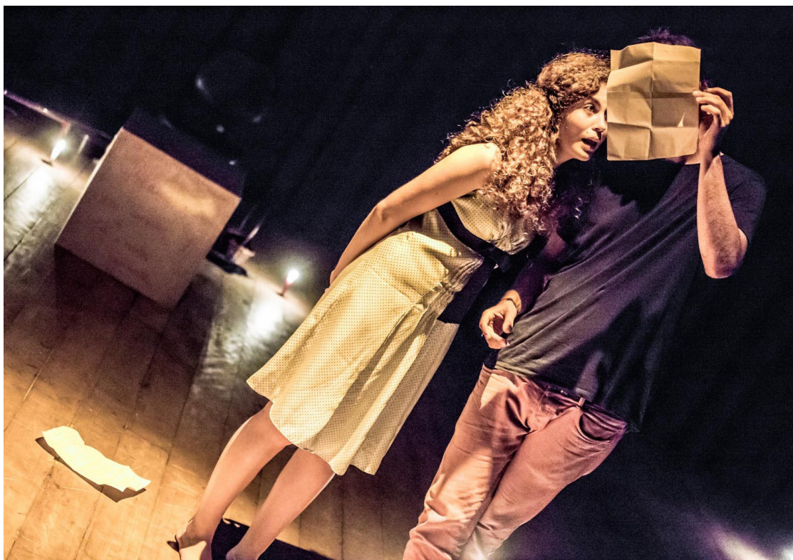
Amor em 3 línguas (2014). Direção: Maíra Wiener e Benedikt Mensing. Atores: Maíra Wiener e Benedikt Mensing.