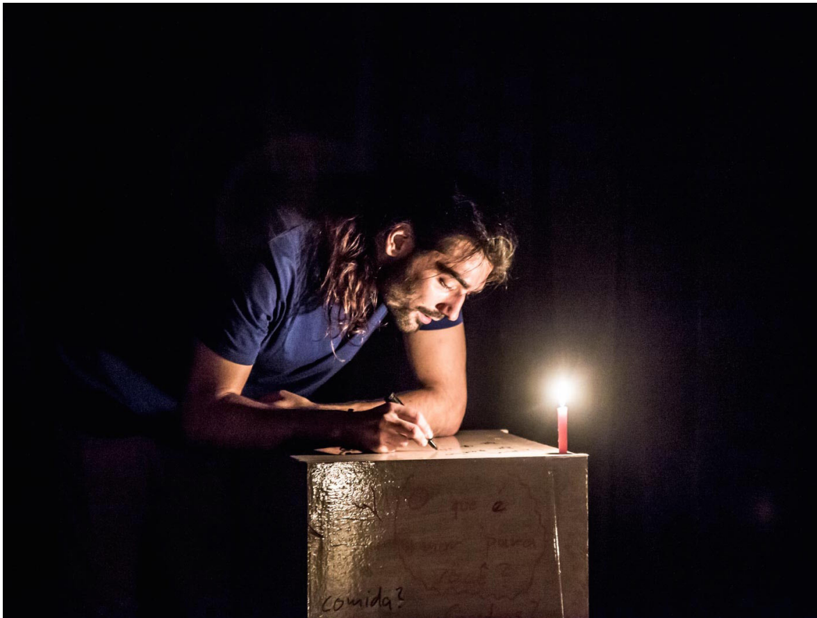
Amor em 3 línguas (2014). Direção: Maíra Wiener e Benedikt Mensing. Ator: Benedikt Mensing.