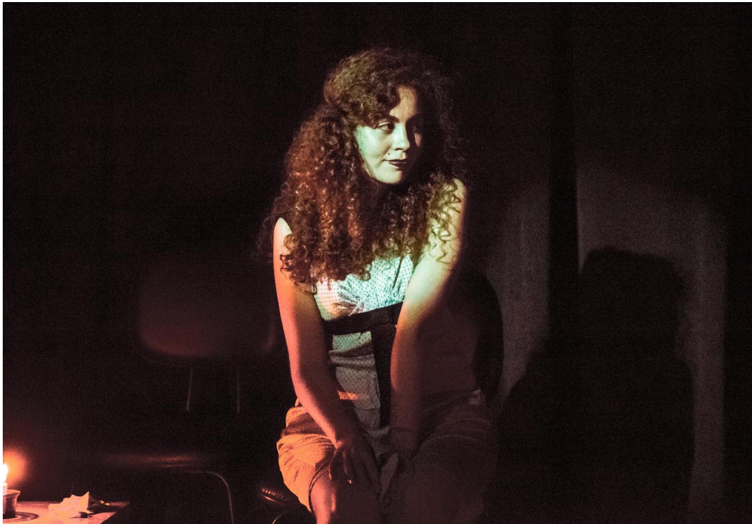
Amor em 3 línguas (2014). Direção: Maíra Wiener e Benedikt Mensing. Atriz: Maíra Wiener.