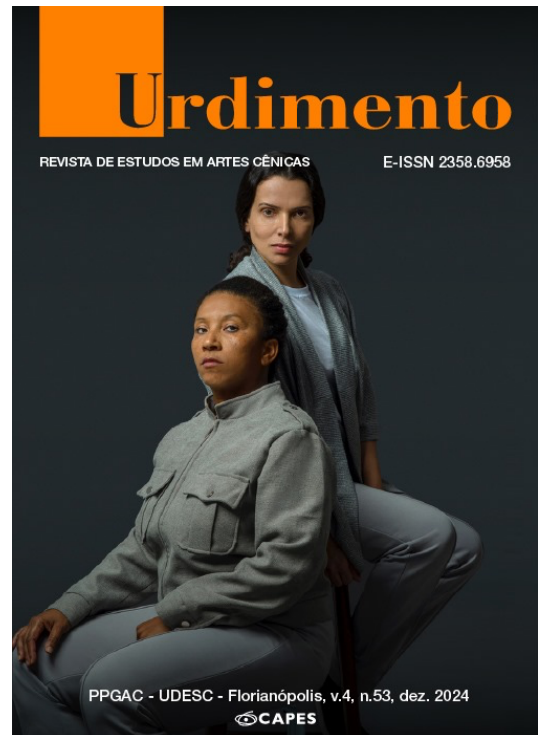
Imagem da Capa Projeto Gráfico: Marcelo Pires de Araújo Espetáculo: Revista Íntima Direção: Vicente Concílio