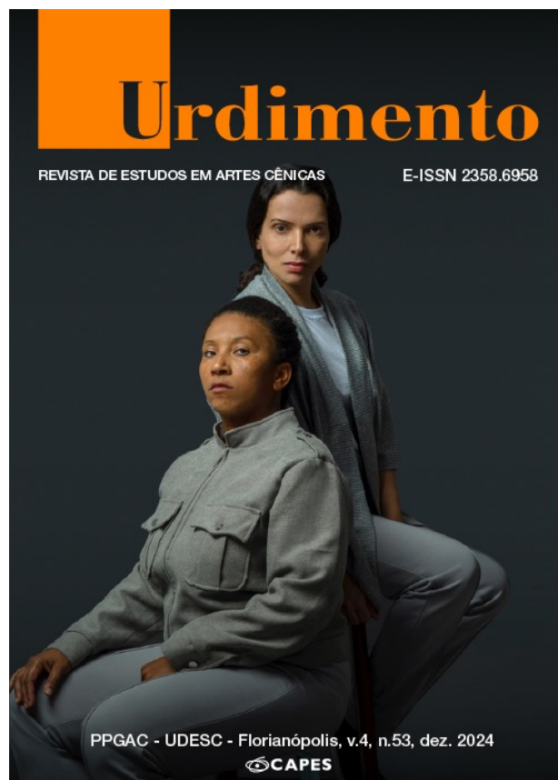
Imagem da Capa

Projeto Gráfico: Marcelo Pires de Araújo