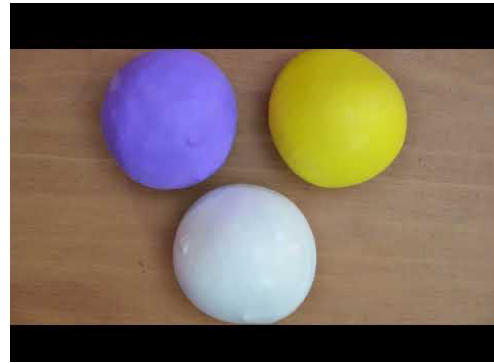
Quadro 1 – Vídeos pedagógicos – confecção de aparelhos de malabares 16