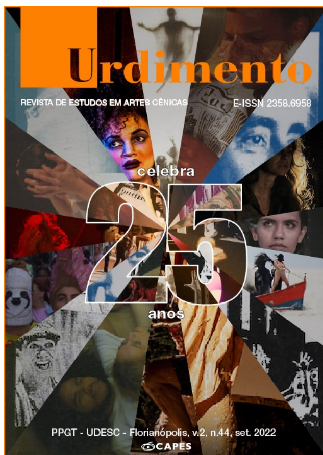
Imagem da Capa Projeto Gráfico: Marcelo Pires de Araújo Capa em homenagem aos 25 Anos do periódico Urdimento