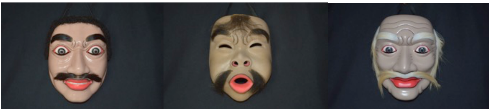
Figura 1 - Máscaras do Penglember: Topeng Keras Manis, Topeng Keras Lucu, Topeng Tua Máscaras e fotos: Igor de Almeida Amanajás

* Existem outras máscaras mais modernas que podem ser adicionadas ao penglember como Topeng Tua Luh (a velha), criação contemporânea do mestre Djimat no ano de 2010.