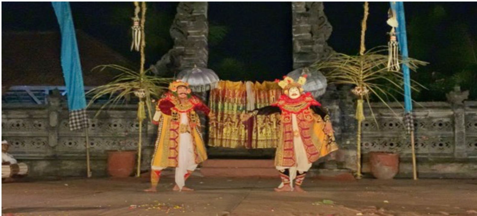
Figura 5 - Gajah Mada (aqui sendo representado pela máscara de Topeng Keras Manis) e Topeng Dalem (o rei do Majapahit) – Tri Pusaka Sakti Arts Foundation – Batuan, 2020

Na segunda parte do espetáculo ouvimos ainda fora de cena a voz encorpada do canto do primeiro servo narrador, Panasar. Panasar é uma figura que não