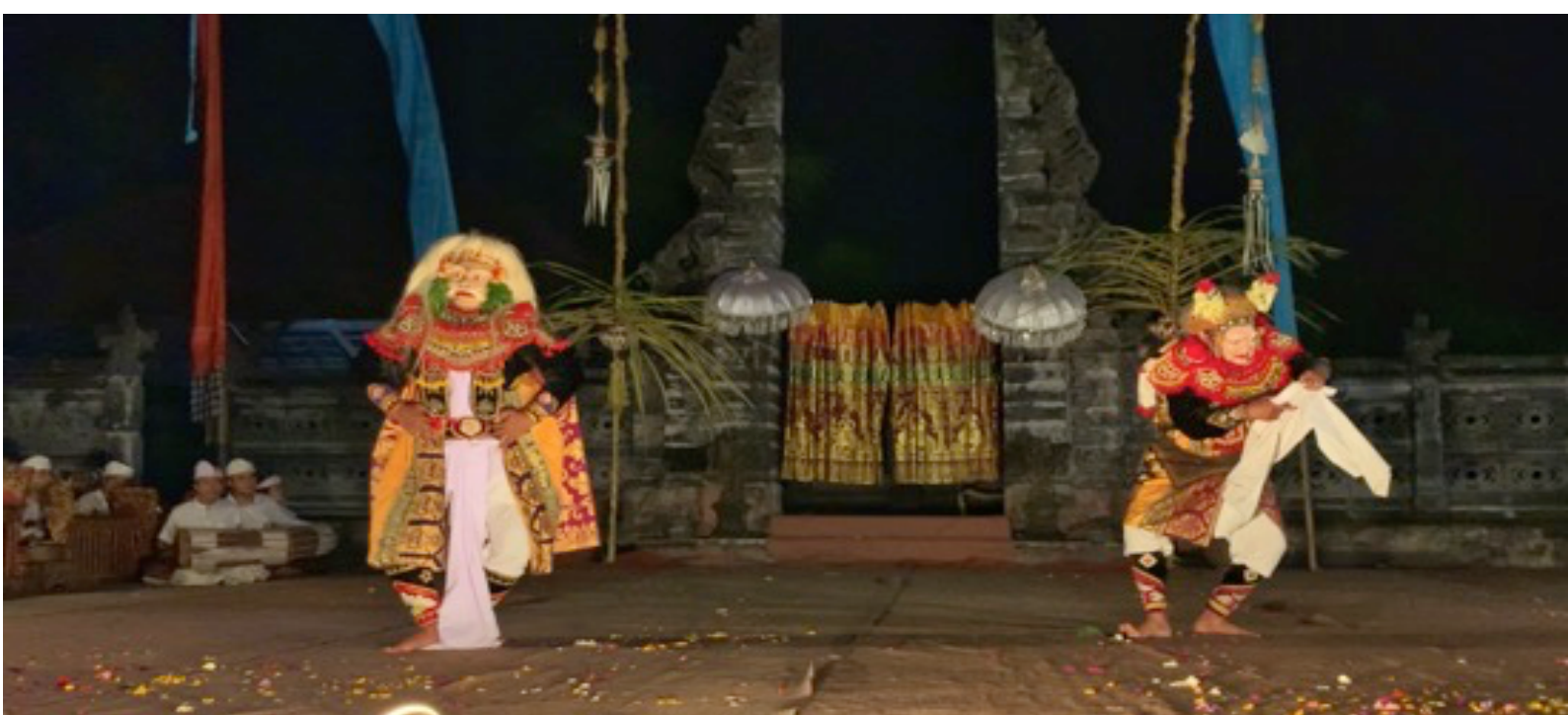
Figura 4 - Topeng Tua (o velho) e Topeng Tua Luh (a velha) dançam juntos. Tri Pusaka Sakti Arts Foundation – Batuan, 2020.

Quando o topeng se inicia a orquestra do gamelan 14 esquentando o público tocando algumas composições, preparando para a entrada do primeiro personagem. O primeiro a descortinar o espaço cênico é Topeng Keras Manis, o