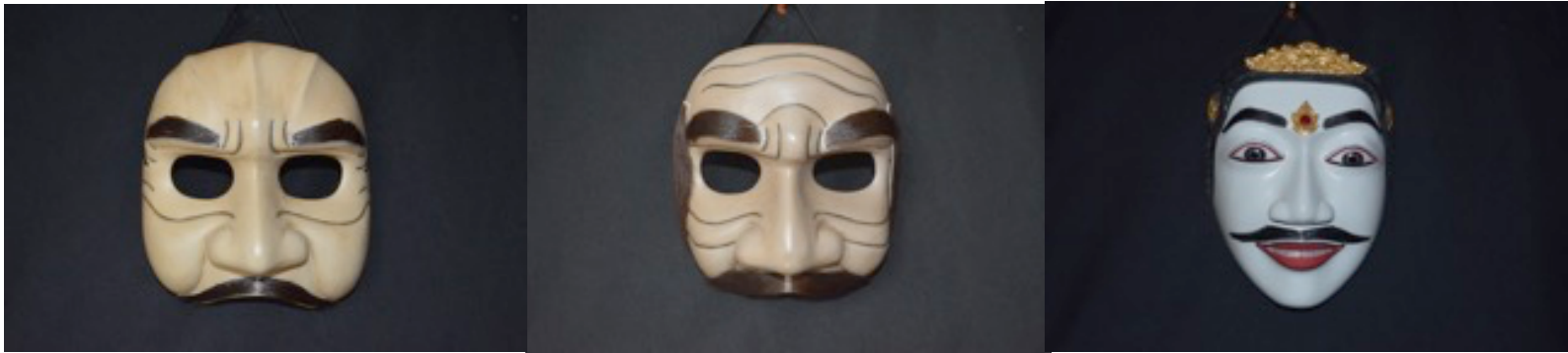
Figura 2 - Panasar, Wijil e Topeng Dalem Máscaras e fotos: Igor de Almeida Amanajás