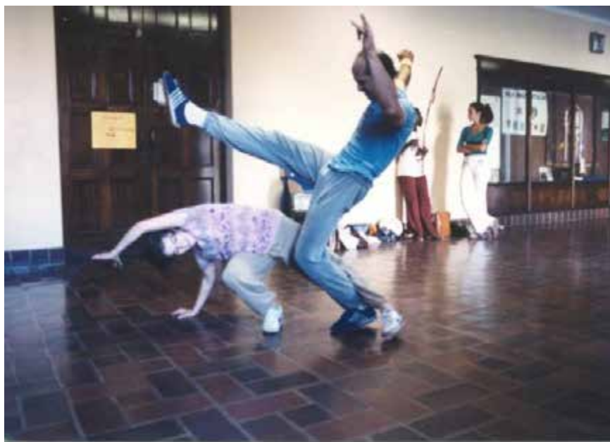
Pariz e a capoeira, em Los Angeles 26

valorizasse a arte da palavra, da narrativa e da construção de personagens complexos. Em todos os projetos que se envolveu, há um elemento em comum que foi a crítica à realidade que vivia, quase sempre esteve explícito o enfrentamento com ditadura civil-militar que ocorria no Brasil. Personagens que duvidavam dos poderes instituídos e que confrontavam um mínimo de ausência de liberdade de expressão.