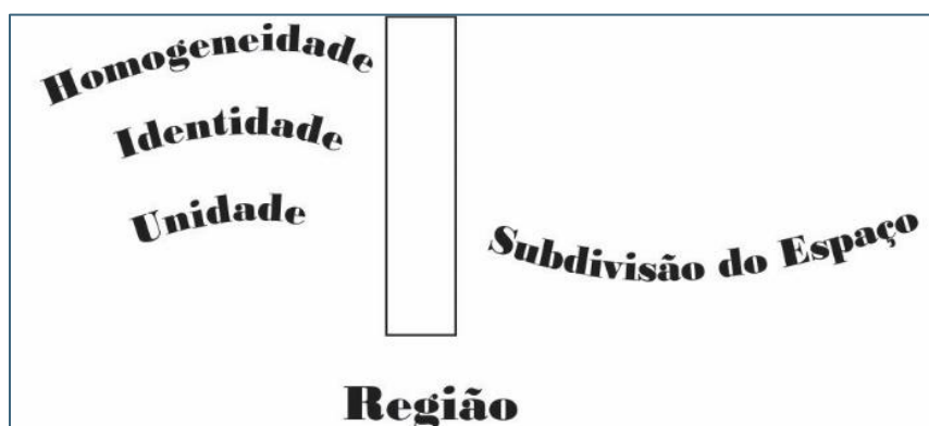
Figura 1: Elementos iniciais para a constituição do conceito de região.

(figura elaborada pelo autor deste artigo).