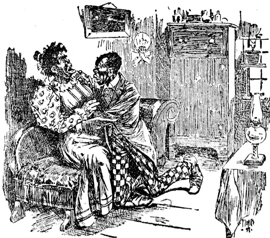
Fig. 2. SEM AUTORIA. Amor... vestido . 1904. impresso, (xilogravura em casca de cajazeira sobre papel pardo, preto) s/d. A Coisa – Biblioteca Pública do Estado da Bahia, Salvador

lar, na quarta página, denominada por Amor... Vestido (fig. 2), título homônimo do texto que a acompanha; e o retrato da pulga transmissora da peste bubônica, na quinta página. A contracapa do periódico é preenchida por reclames sem relação com a peste.