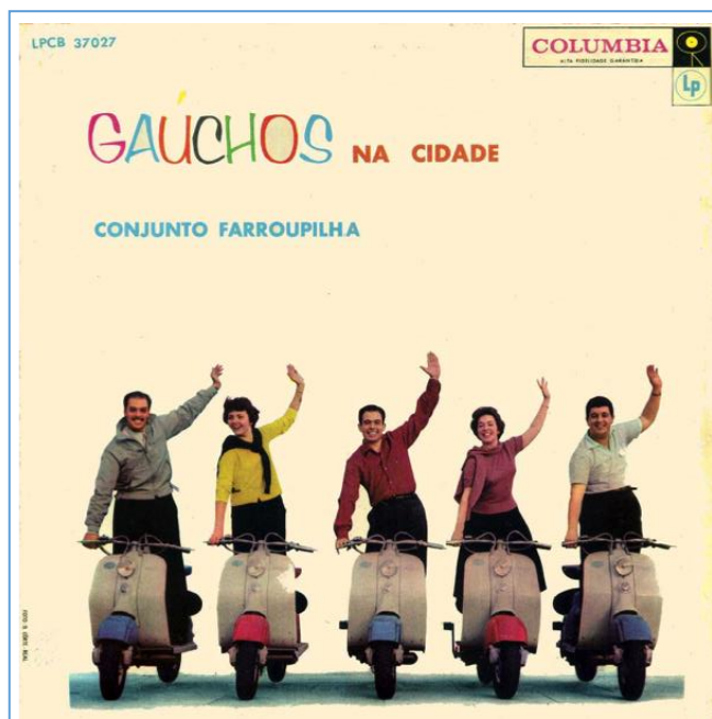
Imagem 5: Capa do LP Gaúchos na Cidade (1959).

Esse LP, além do repertório internacional que perfazia dez das doze faixas, abria com a bolero/bossa “Por causa de você”, de Antônio Carlos Jobim e Dolores Duran (fruto da aproximação com a compositora durante a turnê pela Rússia e China) e com o samba do gaúcho Túlio Piva, “Tem que ter” (“O samba, pra ser samba brasileiro / tem que ter pandeiro/ tem que ter pandeiro/ O samba, pra ser samba na batata/ tem que ter mulata / tem que ter mulata 36 ”). Esse novo desenho de repertório e a capa do LP com o grupo sem as tradicionais pilchas, “gaúchos, não cavalgando seus ‘pingos’ mas esportivamente montados nas suas motonetas” (MACEDO, 1959), denotava a incorporação do Farroupilha como um produto de exportação, ligado a uma nascente indústria cultural transnacional, “moderna”, Bossa Nova. Na contracapa do disco, o jornalista Ricardo Macedo aponta para essa “virada” no perfil do grupo.