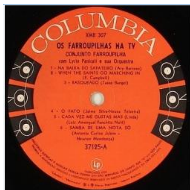
Imagem 6: Rótulo do LP Os Farrroupilhas na TV – 1960.

É preciso chamar a atenção que neste mesmo ano, João Gilberto lança o LP “O amor, o sorriso e a flor”, pela Odeon, onde também constavam “O Pato” e “Samba de uma nota só”, entre outras composições que posteriormente se tornariam ícones da Bossa Nova.