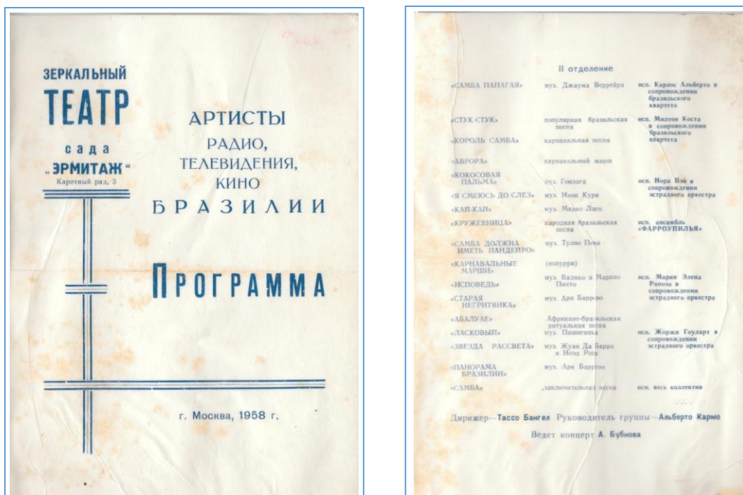
Imagem 2 e 3: Capa e excerto do interior do programa musical executado na Rússia em 1958.