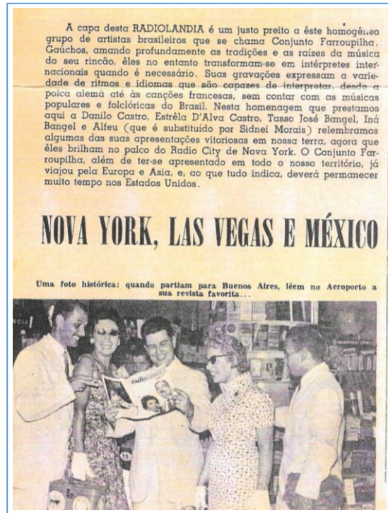
Imagens 8 e 9: Páginas internas da Revista Radiolândia de dezembro de 1960.