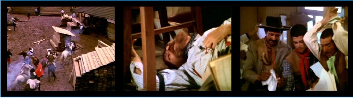
FIGURA 8: Violência e morte no piquete. A Guerra dos Pelados , 1971.

Os pelados remexem nas gavetas e mesas, até encontrar os títulos das terras. Aí, vibram e gritam: “– Chega de pobreza! A terra é nossa!”, ao mesmo tempo em que rasgam e pisoteiam os papéis, chutam os rolos de arame farpado que representam a imposição dos limites territoriais favoráveis à Lumber . À saída, ateam fogo ao local. Por fim, a câmera focaliza as patas dos cavalos, que pisoteiam a placa com o letreiro da Lumber , agora caída ao chão, quebrada e misturada à lama.