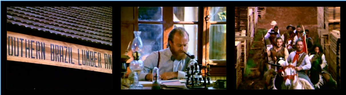
FIGURA 7: A chegada dos rebeldes à serraria. A Guerra dos Pelados , 1971.

Um corte na imagem nos fornece a vista de um escritório, no interior da serraria, onde trabalha um dos “gringos”. No ambiente predominam características europeias. O homem de negócios mantém a feição compenetrada enquanto parece fazer cálculos, atrás de uma escrivaninha, com um cachimbo à boca. Em seguida chegam os sertanejos armados.