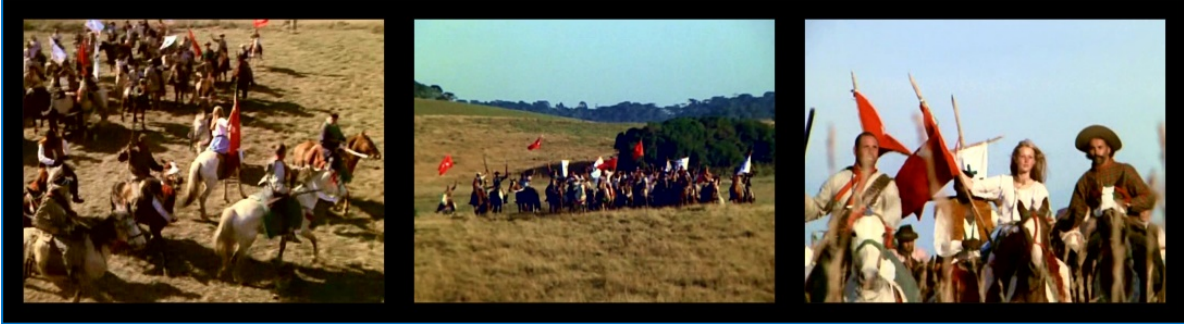
FIGURA 6: Adeodato conclama os pelados ao combate. A Guerra dos Pelados , 1971.

política do grupo, convertida em vontade revolucionária. A afirmação da violência agora é posta como única via para a libertação.