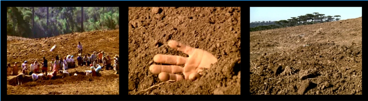
FIGURA 5: Sertanejos são enterrados vivos. A Guerra dos Pelados , 1971.

Para além dessas cenas de coerção, enfim, o filme de Sylvio Back exhibe outro tipo de violência, por meio da figuração do holocausto, com a cena dos “enterrados vivos”.