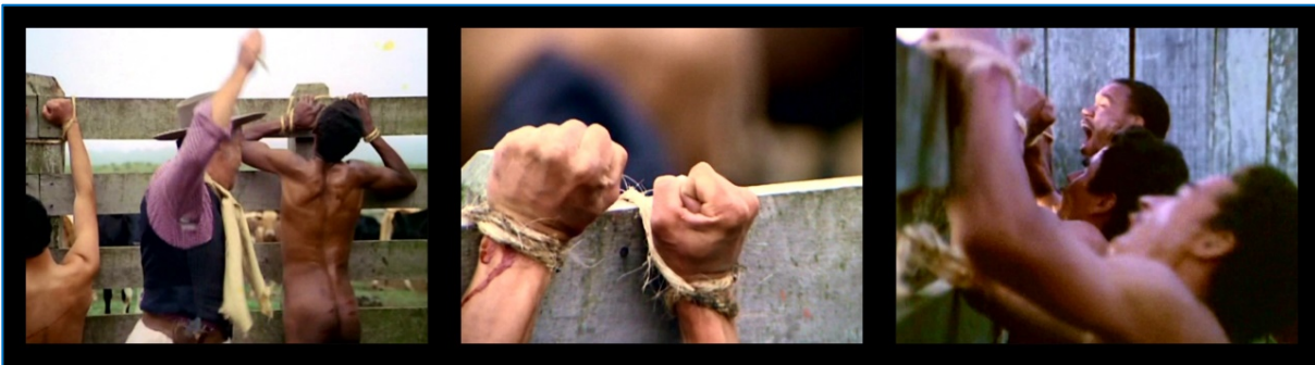
FIGURA 4: Coronel Tidico castiga os pelados. A Guerra dos Pelados , 1971.