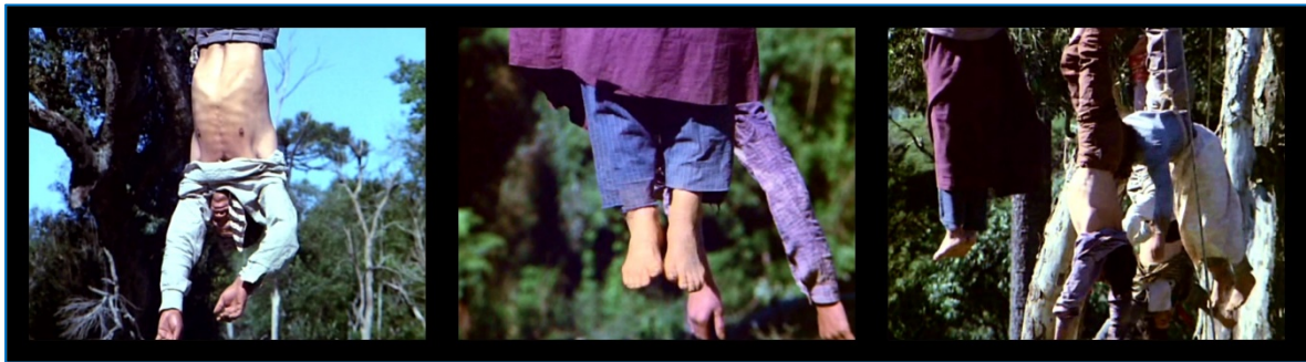
FIGURA 1: Caboclos mortos em A Guerra dos Pelados – função de exemplaridade. A Guerra dos Pelados , 1971.

Peço pouco dessa vida Prá minha felicidade Uma caboclada distorcida Uma viola bem sentida Facão, mate e liberdade.