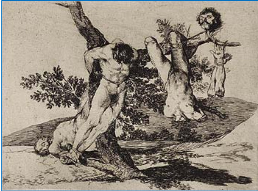
FIGURA 2: Gravura n.º 39 da série Desastres da Guerra, Francisco de Goya (1810-1815).

Essa cena dos corpos na árvore, já no prólogo do filme, aparece como violência “disciplinadora”, por assim dizer, que se justificaria do ponto de vista do poder oficial preocupado em garantir a ordem e o progresso no local.