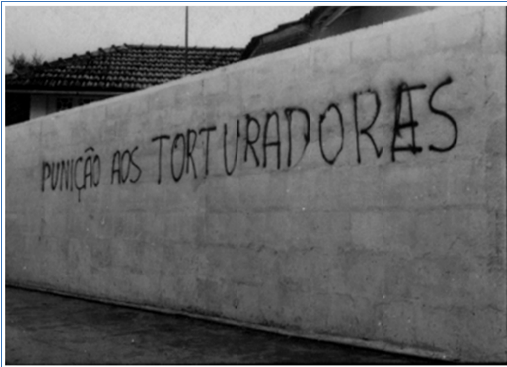
Fotografia 04 Pichações reivindicando punição aos torturadores. Recife, 1980.