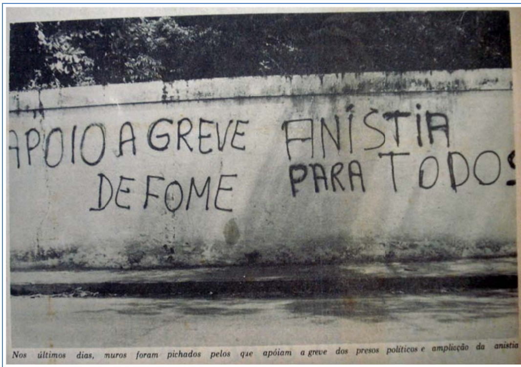
Fotografia 07 Pichações alusivas ao apoio à greve de fome e à luta pela anistia. (Hemeroteca – APEJE. Diário de Pernambuco, 01/08/1979, Cidade, p. A3)

Com a aproximação da votação do projeto de Lei da Anistia, outra alternativa de resistência contra a proposição de uma anistia restrita foi a realização de greves de fome. As pichações “apoio a greve de fome”, “anistia para todos” (fotografia 07), “abaixo a repressão”, “liberdade para os presos de Itamaracá”, “todo apoio à greve de fome”, “terrorista é a ditadura” e “não à anistia do governo” foram realizadas em bairros periféricos e no centro do Recife com o objetivo de divulgar e buscar apoio social para a greve de fome de nove dos onze presos políticos da Penitenciária Barreto Campelo, em Itamaracá/PE, iniciada em 30/07/1979 (Hemeroteca – APEJE. Diário de Pernambuco, 30/07/1979, Capa; Política, p.11. Jornal do Commercio, 01/08/1979, Polícia, p. 23).