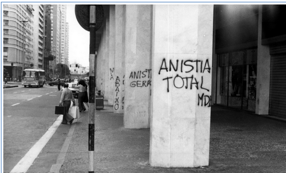
Fotografia 02 Pichações em prol da anistia total, sem identificação do local, 1979.

Enquanto a fotografia 02 é concernente ao uso de pichações em prol de uma anistia “TOTAL” e “GERAL”, com a assinatura do MDB: partido combativo à ditadura e à proposta de anistia parcial do governo. Salientamos que nessas duas imagens os textos escritos nos muros são inteligíveis, diferentemente de algumas pichações atuais, tendo em vista a relevância de se comunicar em um período de censura e repressão social.