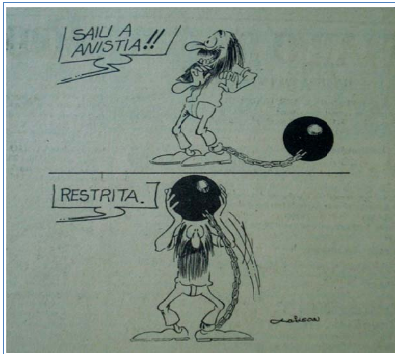
Fotografia 08 Charge “Saiu a Anistia!!”. Hemeroteca – APEJE. Diário de Pernambuco, 23/08/1979, Opinião, p. 11.

Nesse cenário de intensa disputa política, houve muitos debates entre os deputados no dia 22/08/1979, quando o projeto de Anistia foi votado no Congresso Nacional. A sessão foi tumultuada e acompanhada por membros dos Comitês de Anistia e por recrutas das Forças Armadas (Hemeroteca – APEJE. Diário de Pernambuco, 22/08/1979, Capa). Analisemos a imagem a seguir: