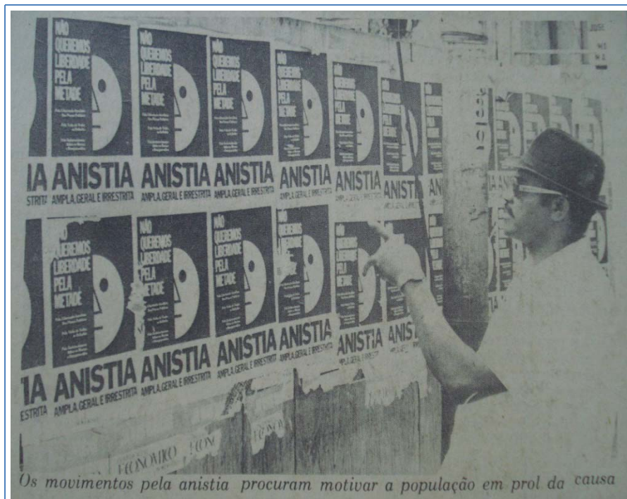
Fotografia 03 Reportagem Anistiar terrorista: sim ou não? (Hemeroteca – APEJE. Diário de Pernambuco , 19/08/1979, Política, p. 6)