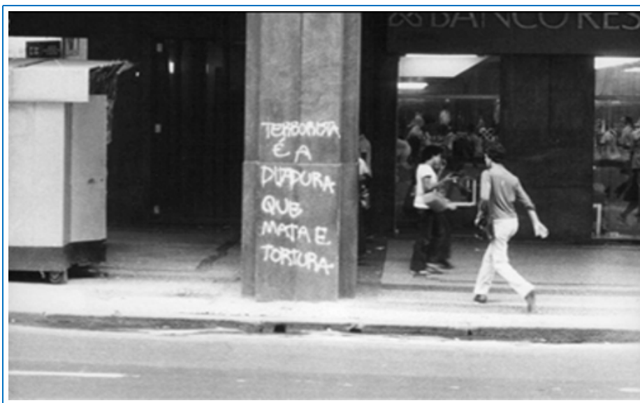
Fotografia 01 Pichação no centro do Rio de Janeiro/RJ, 1979.

(Disponível em: < http://www.memoriasreveladas.gov.br/cgi/cgilua.exe/sys/start.htm?sid=18 >. Acesso em: 12/08/2011)