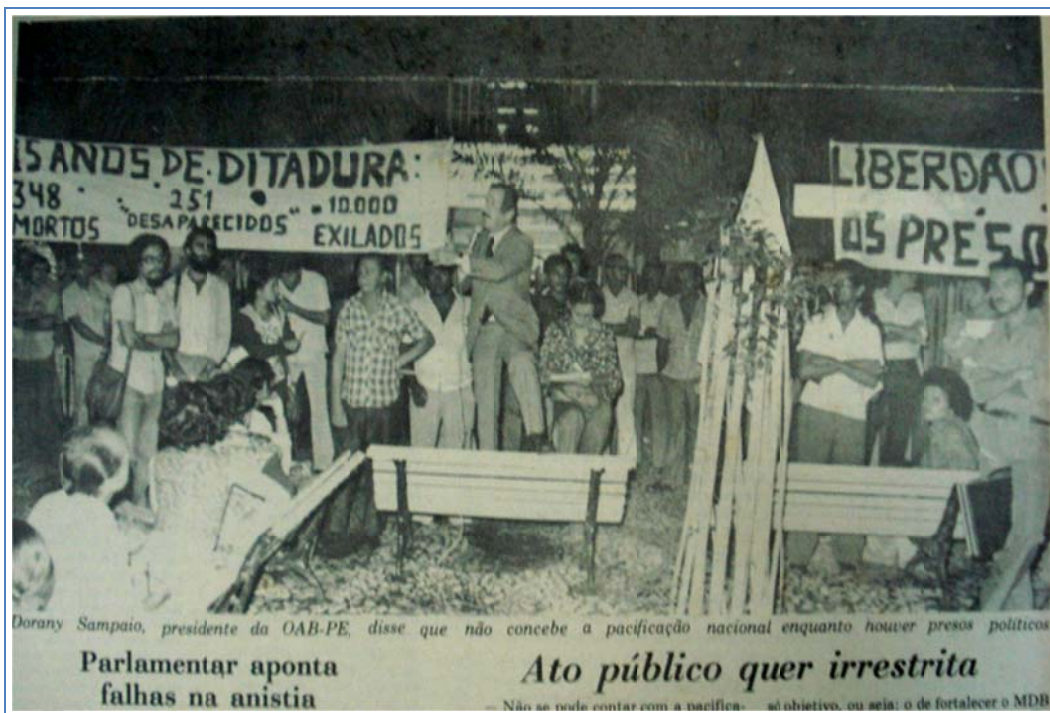
Fotografia 06 Ato público pela aprovação da Lei da anistia ampla, geral e irrestrita.

A fotografia 06 é concernente a esse protesto contra as limitações do projeto de Lei da Anistia de Figueiredo. As faixas expressam a amplitude dessa luta, ao denunciarem o quantitativo de mortos, desaparecidos e exilados durante quinze anos de ditadura militar e divulgarem outro anseio: a libertação dos presos políticos que poderiam ser beneficiados com essa lei. Os bancos da praça tornaram-se um palanque para os militantes discursarem. Se por um lado a estrutura da manifestação foi precária, por outro, ela contribuiu para haver um contato mais próximo com a população presente.