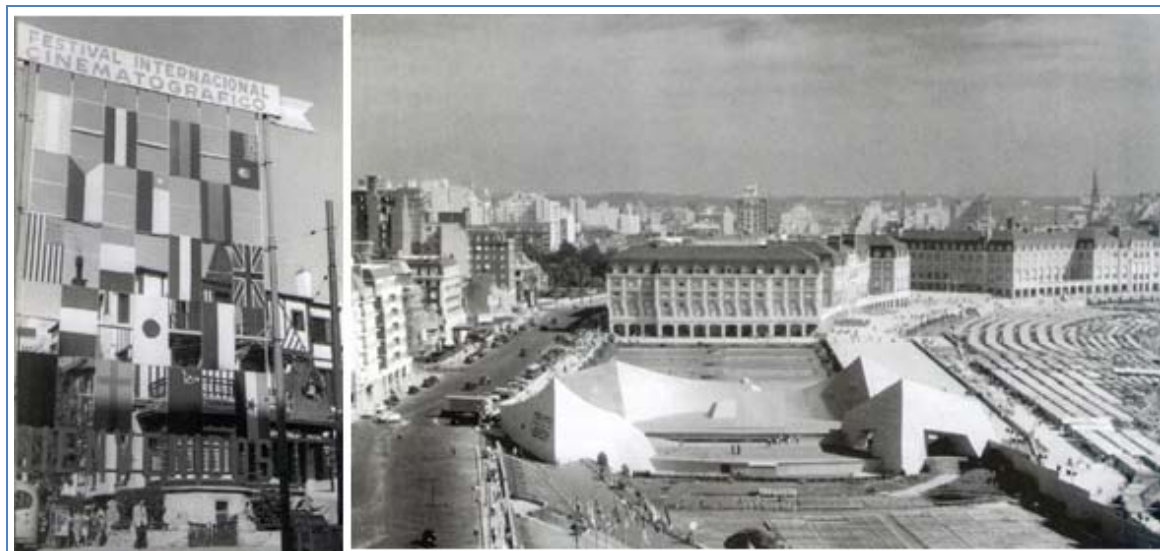
Figura 5a: Fotografías de las escenografías para El Festival Internacional de Cinematografía de Mar del Plata, 1954 | Fotografías do cenário para o Festival Internacional de Cinema de Mar del Plata, 1954 (Mosaico gráfico elaborado por el autor. Cortesía del Archivo Gráfico del CEDODAL y del Instituto de Inv. Hist. Eva Perón. Edición y corrección de imagen: Augusto Marchionni).

Los tres ejes propuestos –el histórico/político, el social/asistencial y el artístico/cultural– condensan cuestiones aparentemente diversas pero que incluyen una serie de fenómenos, todos ellos vinculados al sostenimiento del régimen y la construcción de su imaginario, que se propone señalar más tarde en el contexto de la Fiesta de la Vendimia. Es notable –a partir de reflexionar sobre todo en la profusa obra de gobierno del primer período– el poder y la efectividad que condensó la propaganda oficial con del uso de la prensa y los afiches publicitarios oficialistas. Esta formidable efervescencia que presentó el primer periodo de gobierno también tuvo –como veremos más adelante– su impacto en las resoluciones escenográficas de los años peronistas, con la particularidad de no ser automática sino diferida en el tiempo. En otras palabras, la profusión de actos e imágenes construidas en el primer período de gobierno tendrán su correlato material pocos años más tarde en la Fiesta de la Vendimia.