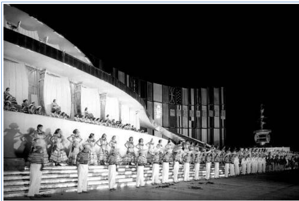
Figura 7: Fiesta de la Vendimia Acto Central de 1954 | Evento principal da Festa da Vendimia de 1954.

La fiesta de 1954 se materializó de modo particular en coherencia con las líneas de pensamiento que venía instaurando el poder político en varios aspectos estratégicos. Así la fiesta de ese año retomó la idea pregonada por el peronismo que pensaba a la Argentina no como un nacionalismo “encajonado”, en palabras del Presidente, sino que debía pensarse en “armonía” con sus vecinos latinoamericanos. El show “Canto a Mendoza” fue dirigido por Ivo Pelay y propuso una reconstrucción histórica de un periodo temporal que iba desde la época de la conquista hasta la lucha por la independencia de nuestro país. Para este cometido utilizó un repertorio de bailes y canciones del continente americano.