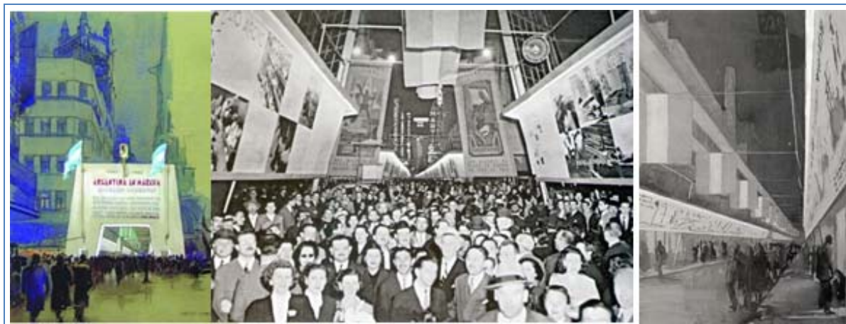
Figura 4: Croquis de proyecto y fotografía de la Muestra Nacional “Argentina en marcha” | Esboço do projeto e fotografia da Amostra Nacional “Argentina em marcha” (Mosaico gráfico elaborado por el autor. Cortesía del Archivo Gráfico del CEDODAL y del Instituto de Inv. Hist. Eva Perón. Edición y corrección de imagen: Augusto Marchionni).

de abajo, el boceto de la entrada, de la mano del autor –Sabaté– y un croquis particular de la propuesta.