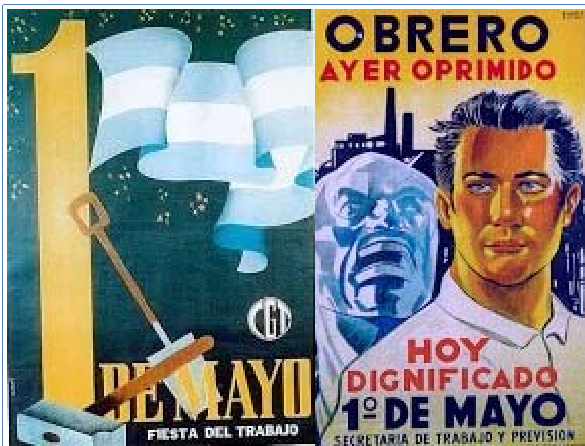
Figura 3: Afiches conmemorativos de la Fiesta del Trabajo | Cartazes comemorativos do Dia do Trabalho. (Mosaico gráfico elaborado por el autor. Cortesía del Archivo Gráfico del Instituto Nacional Juan Domingo Perón de Estudios e Investigaciones Históricas, Sociales y Políticas).

de estos afiches es sin dudas el color. La propuesta está organizada en blancos y negros lo que permite inferir que la intención del estado benefactor era la de difundir este tipo de mensaje–propaganda estatal a una mayor escala de distribución que otros.