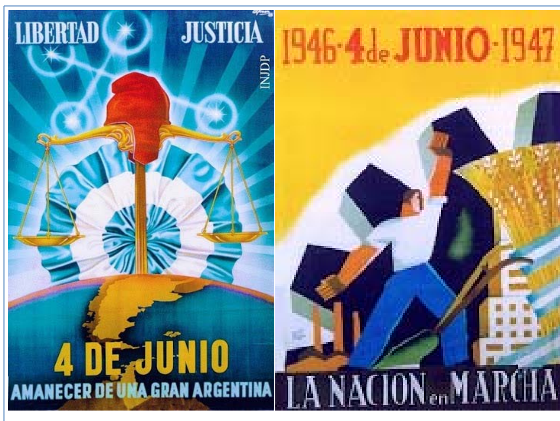
Figura 1: Afiches conmemorativos del primer año del mandato presidencial Perón-Quijano elegida democráticamente el 4 de junio de 1946 | Cartazes comemorativos do primeiro ano do mandato presidencial Perón-Quijano eleito democraticamente em 4 de junho de 1946. (Mosaico gráfico elaborado por el autor. Cortesía del Archivo Gráfico del Instituto Nacional Juan Domingo Perón de Estudios e Investigaciones Históricas, Sociales y Políticas).

El afiche de la izquierda representa el “amanecer de la nueva Argentina” en el cual la escala impuesta en la imagen resulta sideral, cósmica, universal. El centro de la misma está ocupado por una representación de la Argentina continental e insular y su sector antártico. Como contrapunto, aparece al fondo, una enorme escarapela argentina –a modo de Sol de Mayo en forma de Sol Naciente–, la cruz del sur, constelación solo visible desde el hemisferio Sur, y la balanza de la justicia cuyo fiel se encuentra cubierto por un gorro frigio. Completan la composición dos leyendas: en la parte superior “Libertad y Justicia” y en la base: “4 de junio amanecer de una nueva Argentina”, fecha conmemorativa del primer año del mandato presidencial Perón-Quijano elegido democráticamente el 4 de junio de 1946.