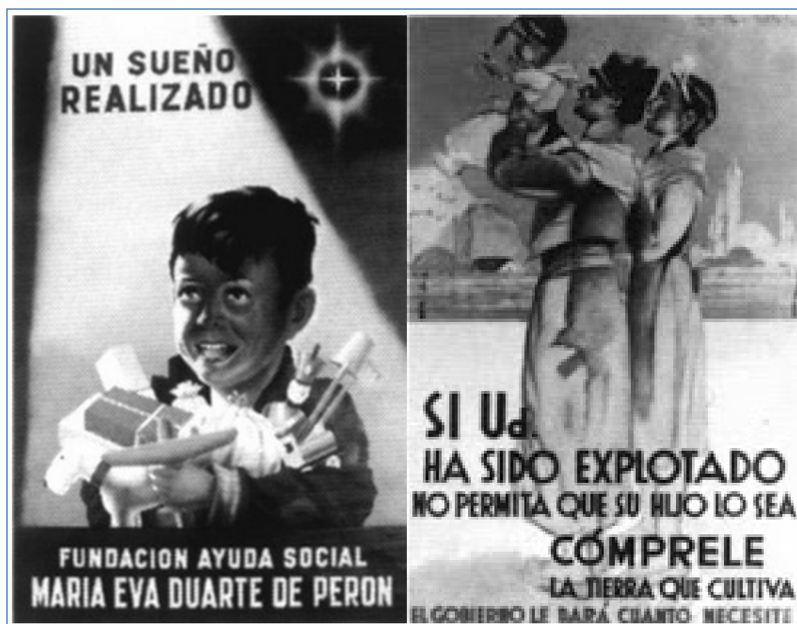
Figura 2: Afiches promocionales de la Fundación María Eva Duarte de Perón | Cartazes divulgando a Fundação Maria Eva Duarte de Perón. (Mosaico gráfico elaborado por el autor. Cortesía del Archivo Gráfico del Instituto Nacional Juan Domingo Perón de Estudios e Investigaciones Históricas, Sociales y Políticas).

Ambas composiciones se destacan elocuentemente por el uso de los colores, el dinamismo compositivo y el poder de sus mensajes. Hacen referencia a momentos históricos distintos: los tiempos preliminares y luego los actuales en los que es posible enfatizar los beneficios del gobierno en funciones luego de su primer año de ejercicio democrático.