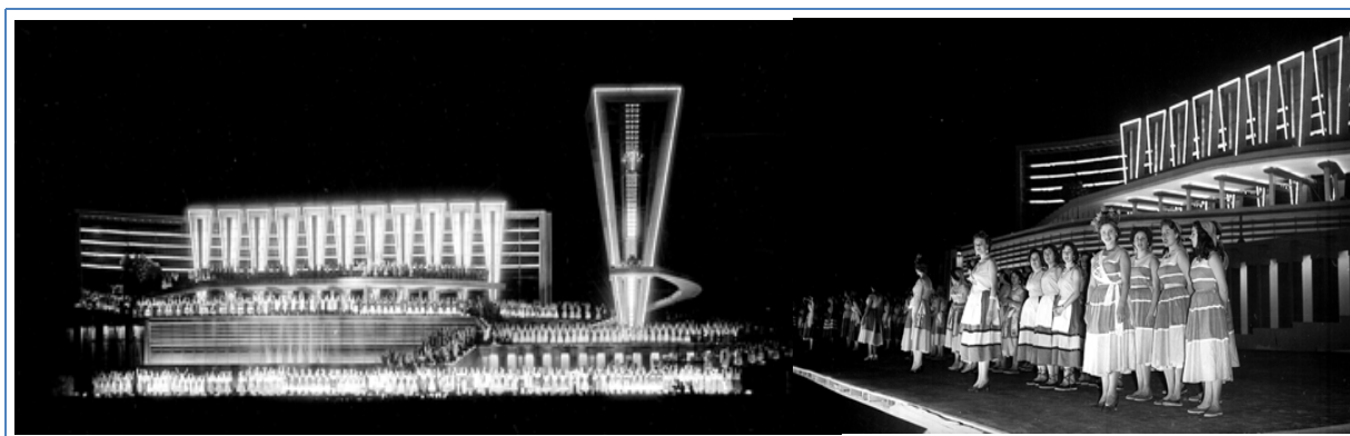
Figura 8: Fiesta de la Vendimia Acto Central de 1955 | Evento principal da Festa da Vendimia de 1955. Mosaico fotográfico elaborado por el autor. Cortesía de Archivo Gráfico CGPG (Coordinación General de Prensa de la Gobernación de la Provincia). Tomada de Sevilla, Ariel y Fabián. La Vendimia para Ver. 70 años de fiesta en 850 imágenes . Mendoza: Ministerio de Turismo y Cultura-Gobierno de Mendoza, 2006, p. 56.

El principal acontecimiento de la Fiesta de la Vendimia –el Acto Central– se desarrolló en el Autódromo del Parque General San Martín la noche del 12 de marzo de 1955. El espectáculo artístico se denominó “Homenaje a las vendimias y a las parras”, en el cual bailaron empleados de comercio, estudiantes y bailarines de la Universidad Nacional de Cuyo, y en la exposición se plasmaron estampas de países productores de vino. No hubo línea argumental. Para ello, se dispuso un escenario de enormes dimensiones, de líneas arquitectónicas modernas y de un particular y distintivo contraste entre el lenguaje formal y estético de los figurantes del espectáculo y el marco arquitectónico efímero (Véanse Figura 8).