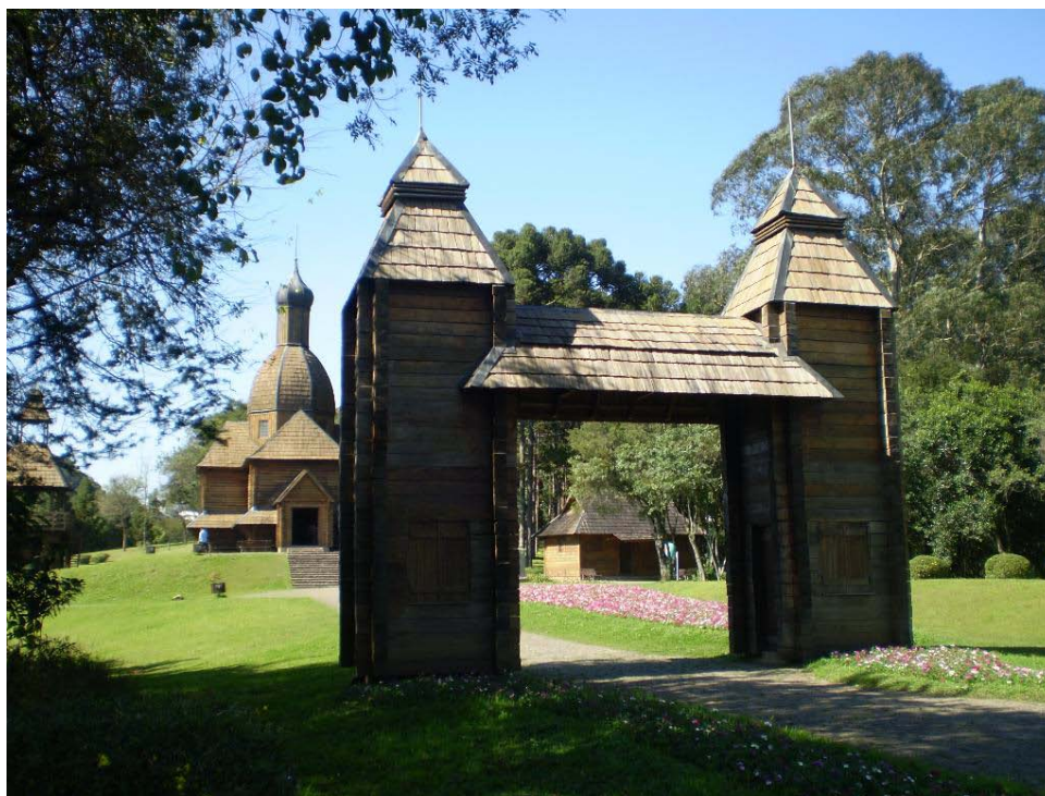
Figura 4 Memorial Ucraniano - Parque Tingui. Jan/2008.

Ao analisar a imagem acima, questiona-se ainda o que na praça há de específico da etnia ucraniana fora o próprio nome? Partindo do pressuposto que o que existe em um lugar tem razão de ser, depoimentos dos moradores locais informam que aos finais de semana, naquele lugar acontece a feira de produtos típicos: artesanato, culinária e peças de cama, mesa e banho com bordados ucranianos. Logo, a casualidade ou a benevolência são substituídas pela intenção.