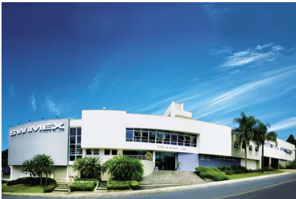
Figura 2 Academia Swimex. Março/2009

O complexo religioso todo murado não é obstáculo para aqueles que do andar superior da academia assistem de soslaio o que se passa no interior da igreja. Do outro lado, o mesmo não acontece: os vidros escurecidos permitem apenas enxergar nuances de pessoas que malham, que praticam lutas, que se embelezam. Talvez, nas cidades modernas, os muros sejam maneiras ultrapassadas de delimitar territórios e segregar o que nele está contido. Hoje, nas cidades verticalizadas, os vidros, o aço e sistemas de segurança - que se crêem eficientes - produzem nas pessoas da urbe uma sensação de segurança, cuja eficácia por vezes é contestada. De toda forma, sejam os religiosos que circulam de um lado da avenida, sejam os frequentadores da academia de outro, ambos se confrontam com realidades plurais, com mundos formados não apenas por aquilo que se conhece ou se quer conhecer, mas por mundos onde pululam as especificidades e as diversidades tão próprias do adensamento urbano, que exigem a reciprocidade de respeito.