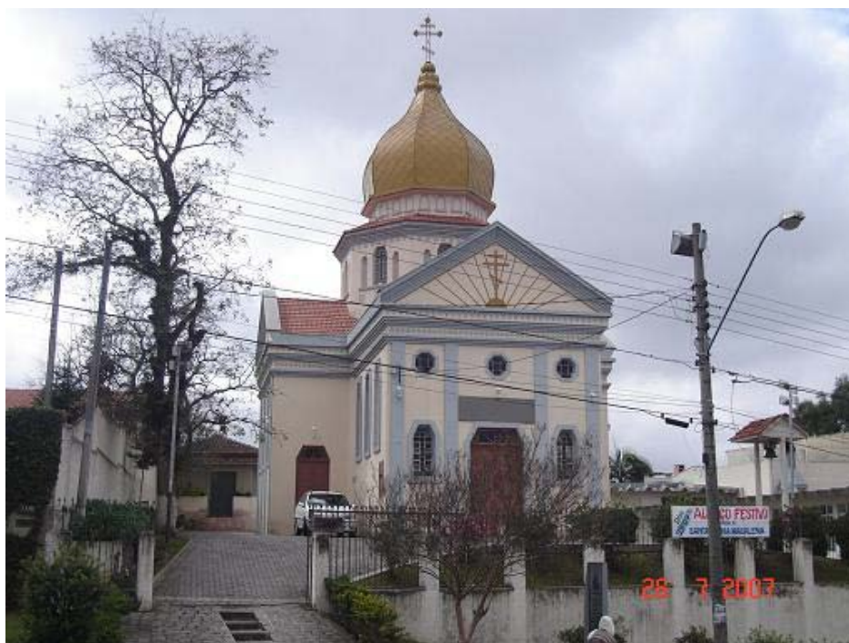
Figura 1 Catedral Ortodoxa São Demétrio. Jul/2007.

Nas décadas de 1970 e 1980, na Cândido Hartmann, aos poucos, antigas moradias foram substituídas por casas do comércio que por sua vez foram repaginadas, ganhando marcas do progresso. As geografias desiguais foram nivelando-se pelos ditames de uma época marcada pela intensa efervescência da criatividade urbana. O banal e o marginal metamorfoseiam-se em lugares de distinção e de sobriedade, demonstrando que lugares são frágeis, vítimas das práticas arquitetônicas e das “opções de um urbanismo servil que visa o lucro em detrimento da cultura” (ANSAY, SCHOONBRODT, 1989, p.16).