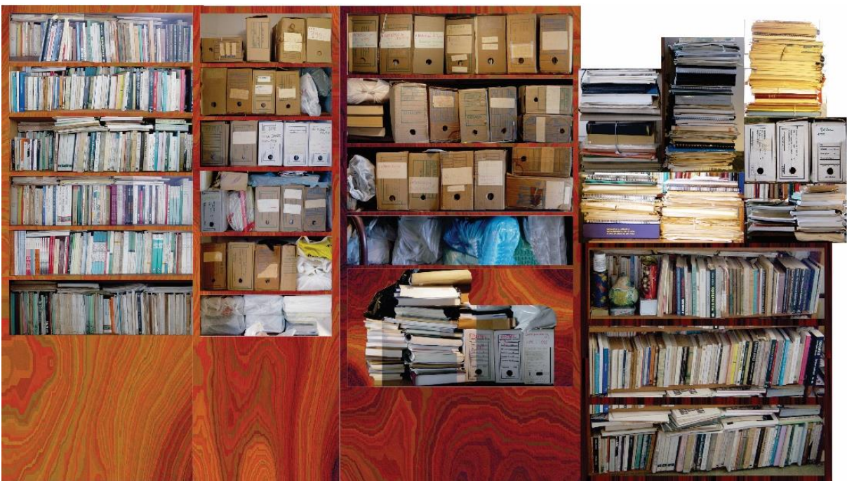
Figura 3 - Biblioteca e arquivo de Milton Santos em sua residência. À frente e atrás de algumas estantes, havia duas fileiras de livros