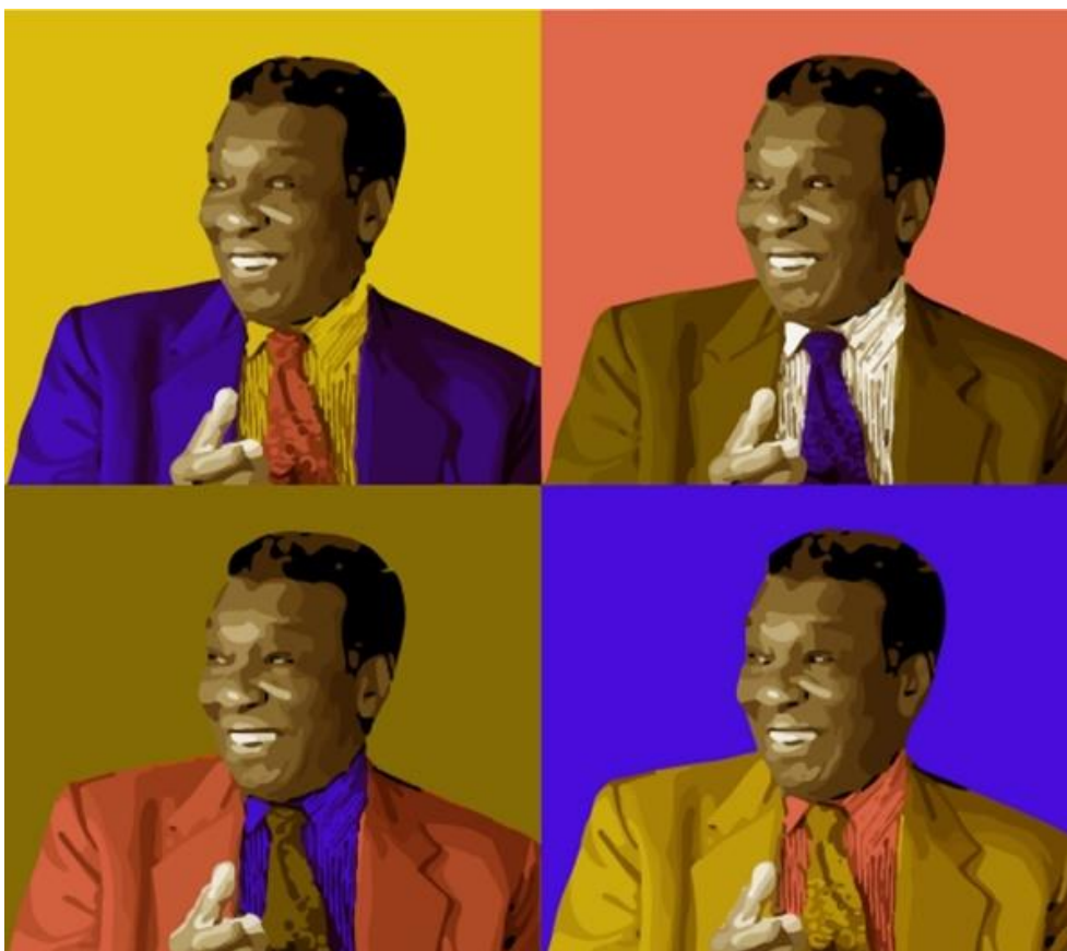
Figura 2 – Milton Santos pop

A interdisciplinaridade do pensamento de Milton Santos, presumivelmente, não pode ser atribuída a sua obra, que não é interdisciplinar. Ela é, essencialmente, geográfica. Disciplinarmente geográfica. Entretanto, as proporções de seu alcance ultrapassam os “muros altos e grossos da universidade”, e, também da geografia. Os exemplos da aplicação não geográfica de seus ensinamentos são provas cabais de que eles são autenticamente geográficos.