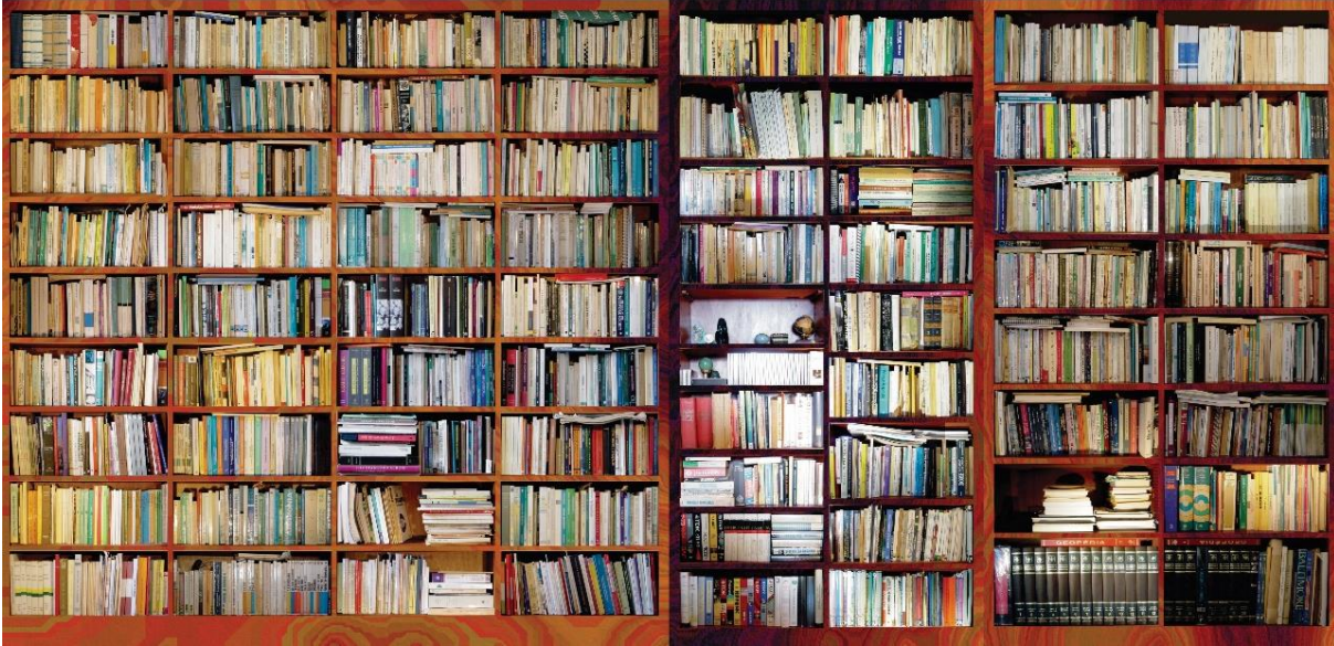
Figura 2 - Biblioteca e arquivo de Milton Santos em sua residência. À frente e atrás de algumas estantes, havia duas fileiras de livros