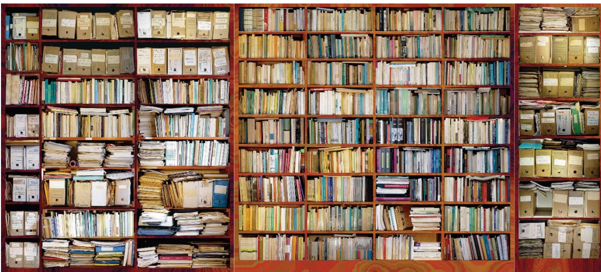
Figura 1 - Biblioteca e arquivo de Milton Santos em sua residência. À frente e atrás de algumas estantes, havia duas fileiras de livros

Depois de 851 dias, em 23 de outubro de 2003, iniciaram-se as sessões de fotografias. O trabalho foi concluído logo após, em 4 de novembro (Figuras 1, 2 e 3). Ao mesmo tempo, montava-se o banco de dados disposto sob uma interface gráfica. Em ambiente web , permitiria “abrir” as prateleiras e pilhas e vasculhar seus conteúdos. Por isso a catalogação segundo os elementos referenciais.