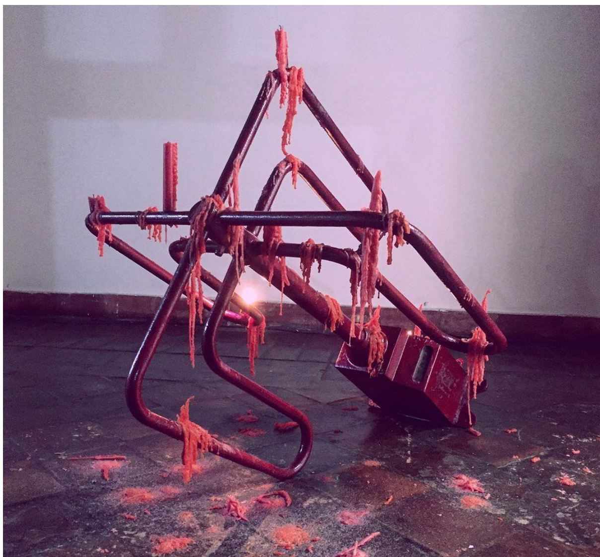
Figura 3 - Trabalho Catracalizações

Lia Letícia, 2018. Museu da Abolição, Exposição Entremoveres.