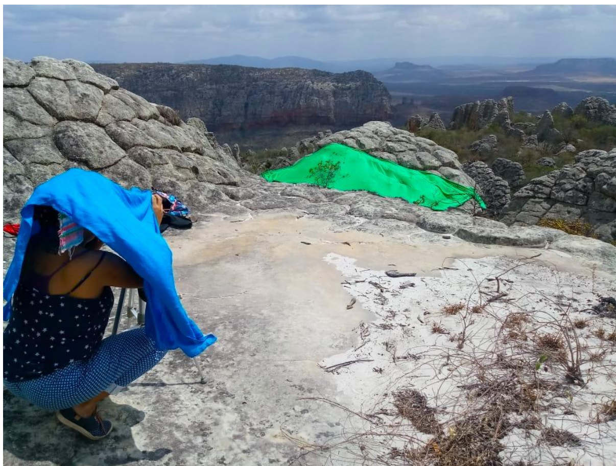
Figura 8 - Residência em Vila do Catimbau/Buique (em desenvolvimento)