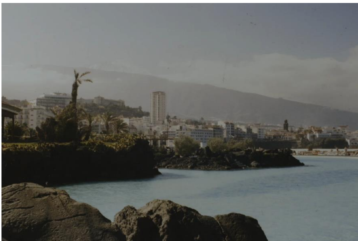
Figura 6 - Frame do Filme Thinya

Fonte: Acervo particular de Lia Letícia. Direção Lia Letícia, 2018.