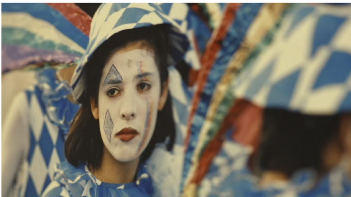
Figura 4 - Still do filme Thynia

Fonte: Acervo particular de Lia Letícia. Direção Lia Letícia, 2018. Foto: Diogo Amorim.