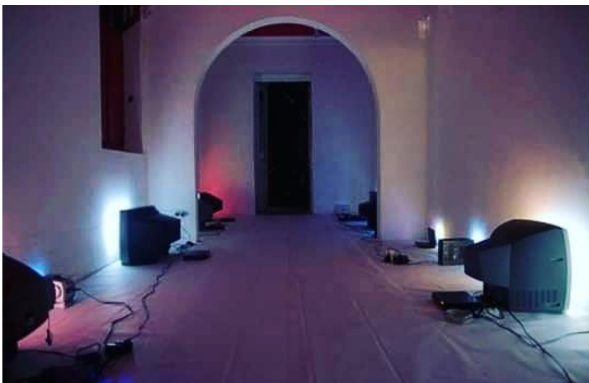
Figura 2 - Evento CineCão na Galeria MauMau