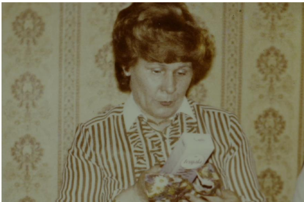
Figura 5 - Fragmento do filme Thinya