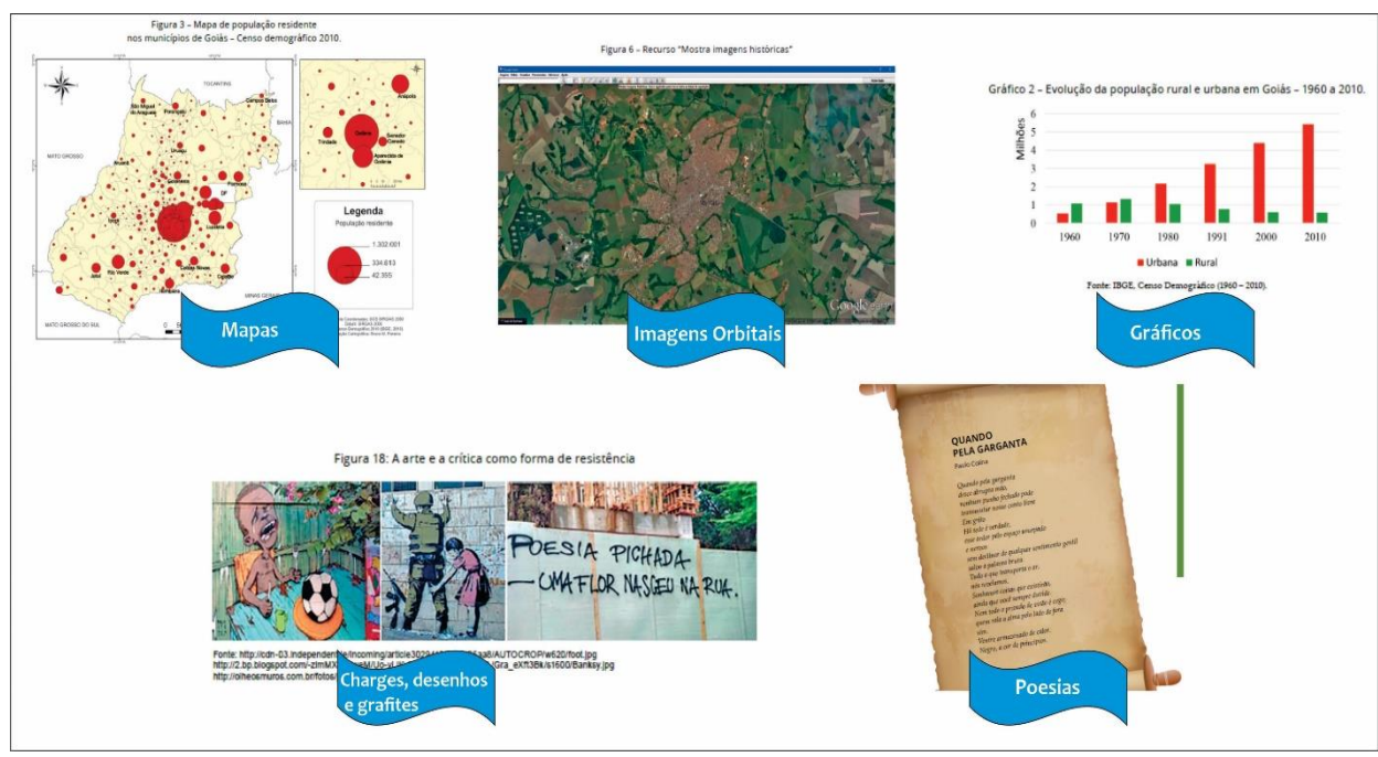
Figura 02 – Exemplos de imagens para leitura, interpretação e análise no material didático