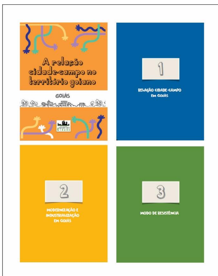
Figura 01 - Seções temáticas do material didático