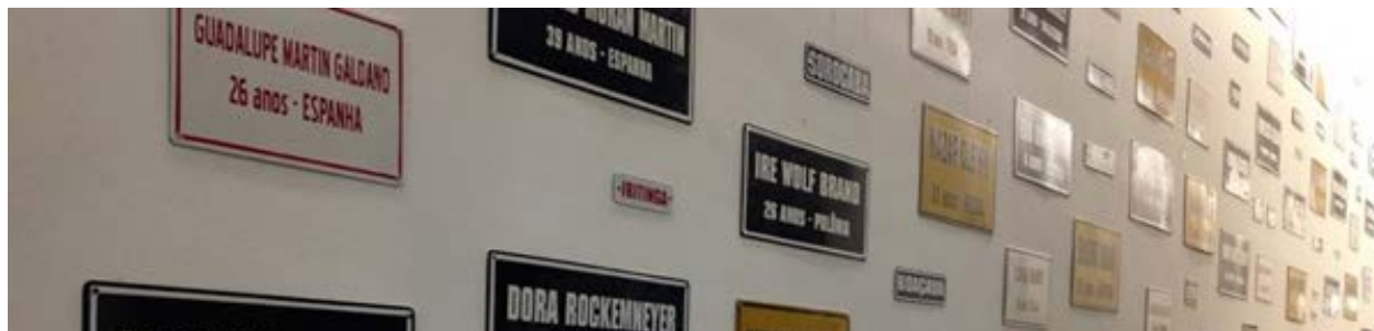
Ilustração 2: O Projeto Parede- Marapé , no MAM-SP, é um exemplo de como aspectos do Romantismo ainda permanecem no imaginário do espectador.

O texto explicativo no site do MAM-SP diz que, ao misturar nomes, países de origem e a idade com que chegaram ao Brasil, a artista tenta explorar a ligação familiar, a memória e a realidade desses imigrantes. O que o texto não fala, mas fica subjetivo para o espectador que entra em contato com tal obra, é a importância de conhecermos as origens, saber de onde veio; o fato é que, ao pôr em discussão questões referentes à nacionalidade, a artista já recupera um legado romântico, pois, segundo Raymond Williams (2007, p. 285), foi exatamente durante o Romantismo histórico que o termo nacionalidade “adquiriu seu sentido político moderno”.