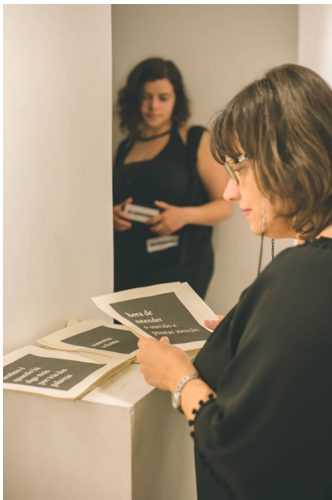
Fig.2 Priscila Costa Oliveira, Disparadores de conversação, 2018.

Vista da exposição Convers[a]tiva da 14ª Bienal de Curitiba no espaço NACASA coletivo, Florianópolis/SC.