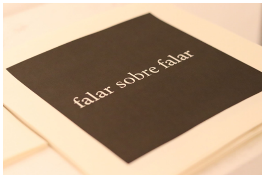
Fig.3 Priscila Costa Oliveira, Disparadores de conversação, 2018.

Vista da exposição Convers[a]tiva da 14ª Bienal de Curitiba no espaço NACASA coletivo, Florianópolis/SC.