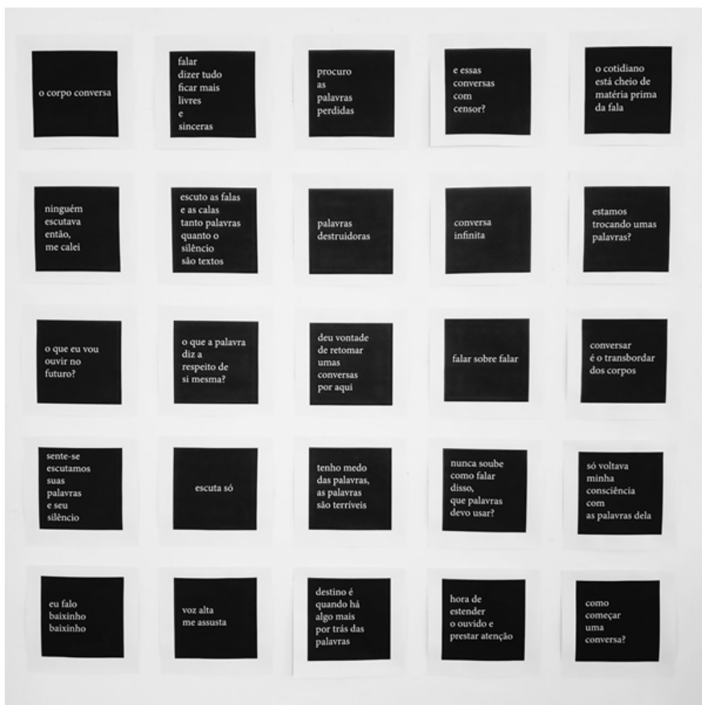
Fig. 1 Priscila Costa Oliveira, Disparadores de conversação, 2018.

Vista da exposição Conversativa da 14ª Bienal de Curitiba no espaço NACASA coletivo, Florianópolis/SC.