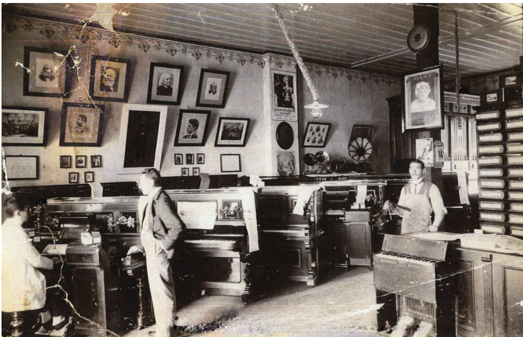
Fig. 4 - Casa Hertel, Curitiba-PR, início do século XX Fornecedora do instrumento da paróquia. Em primeiro plano, um pequeno harmônio , tal qual descrito no Livro Tombo.

Os harmônios seriam instrumentos essenciais para as capelas do interior, por seu baixo custo, fácil manutenção e transporte. A posição estratégica das fábricas e lojas no Paraná e Rio Grande do Sul vinha a suprir a crescente demanda de Santa Catarina: com poucos recursos, nem todas as igrejas podiam ter um órgão de tubos. Sendo proibida a utilização de pianos e de “instrumentos fragorosos” (como tambor, bombo, pratos e campainhas) nas igrejas católicas, os órgãos e harmônios continuariam a ser indispensáveis para a música sacra em todo o país, ao longo do século XX. Determina-se, através do Motu Proprio , que “posto que a música da Igreja é meramente vocal, contudo, também se permite a música com acompanhamento de órgão” 45 . E, como vimos anteriormente, vedava-se o uso do órgão na música própria dos ministrantes, sugerindo-se a utilização pelos levitas. É interessante notar a preocupação de frei Menandro em adquirir um harmônio naquele momento específico – no fim de 1913, ano da chegada dos Steffen-Werner em Canoinhas – visto que a capela sequer tinha bancos suficientes, e muitos fiéis tinham que se sentar no chão. Já se via necessário criar uma estrutura de música sacra na paróquia.