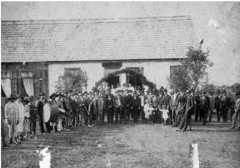
Fig. 5 - Solenidade de Instauração da Comarca de Canoinhas. Canoinhas, 1913 Sermão de frei Menandro Kamps e música pela Banda “Lyra Catharinense”. Colaboração entre igreja e comunidade. 50