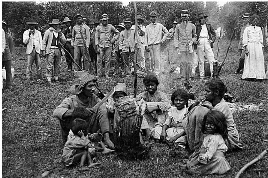
Fig. 6 - Família de sertanejos se rende às Forças Oficiais. Canoinhas, 1915 “Homens, mulheres e crianças famintas em completos andrajos de mendicidade, entraram nesta villa como uma tropa dispersa implorando perdão.” 52

É deste contexto que vem a segunda missa campal realizada na praça Lauro Müller – agora não apenas aos militares e comunidade paroquial, mas aos cativos do exército, na presença do General Setembrino de Carvalho. Isso em janeiro de 1915: