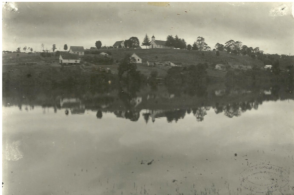
Fig. 1 - Vista parcial de Canoinhas, então chamada "Ouro-Verde", 1927 No alto da colina, a capela de Santa Cruz, sob a condição de Matriz. Enchente de 1927.