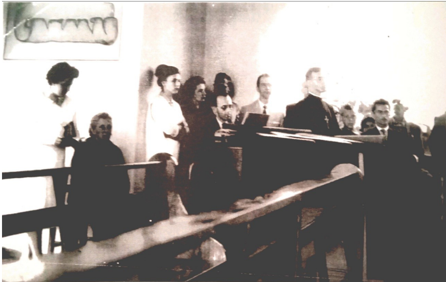
Fig. 3 - Missa de Inauguração da Capela de Santa Cruz. Canoinhas, 1961.