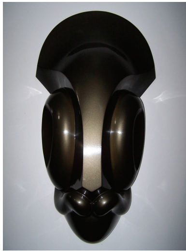
Figura 4 - Dimas Rosa. Máscara IV. 1977. Fibra de vidro e acrílica marrom castor. 58x 110x28cm. Acervo Dimas Ricardo Rosa.

A última fase apresentada pela autora é caracterizada pela tridimensionalidade das obras, onde as figuras assumem um caráter “sintético e simbólico”, evidenciados nas criações de máscaras; e um caráter “mais descompromissado” ao adquirirem mais dinamismo, a partir da busca pelo movimento nas formas (fig.4).