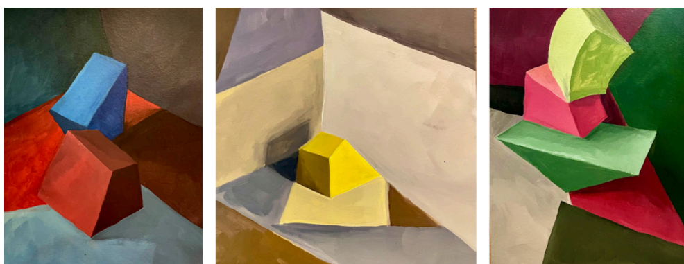
Figura 2: Tríptico de Estudos para a série “Modulações Cromáticas”. Acrílica sobre papel preparado. I, esquerda (35x20cm), II, centro (20x25cm), e III, direita (35x20cm).

Ao analisar as práticas de ensino e criação de Johannes Itten, reconheci a potência de sua metodologia como convite à experimentação e à consciência perceptiva. Inspirado por esse olhar, desenvolvi a série “Modulações Cromáticas” (Imagem 02), um conjunto de pinturas que investiga os sete contrastes cromáticos propostos por Itten (1973). Utilizei as caixas que compõem o círculo cromático como elementos de construção compositiva, buscando compreender, pela relação entre forma, figura e fundo, o comportamento da cor em situações concretas de contraste, equilíbrio e tensão. A produção pictórica assumiu um papel mais investigativo do que expressivo, permitindo repensar modos de aprender a partir da própria prática. Nesse sentido, a abordagem a/r/tográfica tornou-se essencial por acolher a indissociabilidade entre criação, docência e pesquisa, valorizando o pensamento visual e o aprendizado como experiência estética, conforme propõe Irwin (2013).