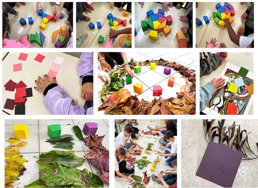
Figura 3: Fotomontagem. Práticas realizadas com o Círculo Cromático Modular com estudantes do 5º ano da Escola de Educação Básica Rosa Torres de Miranda, Florianópolis.

Percebo ao longo das aulas que a configuração do CCM em peças móveis intercambiáveis favorece um manuseio mais lúdico e uma montagem intuitiva mais negociável entre os envolvidos. Antes de iniciar a atividade de coleta de folhas, optei por não apresentar previamente a imagem do círculo cromático de Itten. Com objetivo de que os estudantes descobrissem o círculo por dedução e experimentação, construindo-o a partir do diálogo e da negociação. Propus, que montassem as peças sem revelar sua natureza ou finalidade, permitindo que a turma sentisse e compreendesse cada peça individualmente, criando vínculos perceptivos e cognitivos antes de alcançar a compreensão do conjunto com uma função específica.