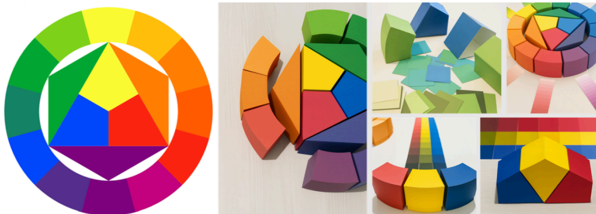
Figura 1: Círculo Cromático de doze cores de Johannes Itten (esquerda). Círculo cromático objeto, apresentando diferentes composições, destacando-se os cards e possíveis montagens compositivas (centro e direita). (Fonte: Johannes Itten, 1973; produção e acervo do autor, 2022; acervo Estúdio de Pintura Apotheke , 2022).

tradução cromática. Essa reinterpretação sustenta a continuidade do meu trabalho como professor artista e reafirma a cor como campo privilegiado de experiência, reflexão e invenção no ensino das artes visuais.