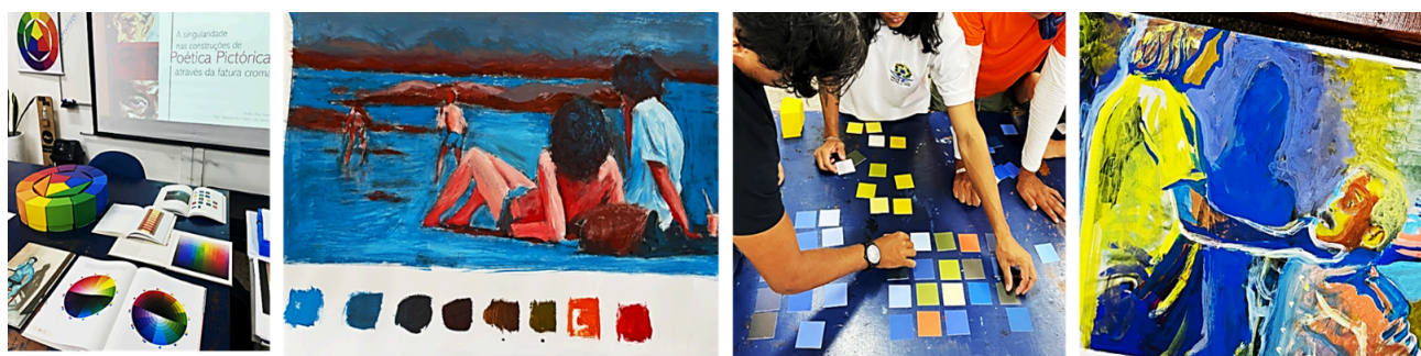
Figura 4: Registros da Microprática "Contrastes Cromáticos: Imagens do Cinema Latino-americano, Estudos Cromáticos de Johannes Itten e Processo Pictórico", realizado com estudantes de graduação do curso de Licenciatura em Artes Visuais da Universidade Federal do Amapá. Nas imagens, utilização do CCM para tradução de atmosfera cinematográfica para composição pictórica.

Com um olhar mais atento e analítico sobre as imagens produzidas, conversamos e observamos que as escolhas cromáticas se afastaram do repertório habitual dos participantes, rompendo com o imaginário recorrente presente em suas produções individuais. Essa mudança possibilitou uma sofisticação narrativa e uma abertura perceptiva a nuances até então pouco exploradas. Muitos participantes, ao serem desafiados a trabalhar com um contraste cromático previamente determinado, relataram ter adquirido nova compreensão sobre a característica da cor carregada de predefinições, antes restrita às suas preferências pessoais e escolhas recorrentes de paleta. Compreendo, assim, que a elaboração de desafios dentro destas micro práticas constitui um mecanismo propositivo essencial pois instauram situações que direcionam a experimentação, a tomada de decisão e o pensamento crítico.