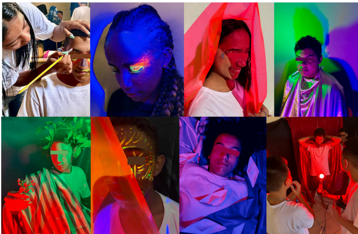
Figura 3: Fotomontagem. Ensaios fotográficos produzidos com estudantes do 9º ano da Escola de Educação Básica Rosa Torres de Miranda, Florianópolis, voltados ao estudo de contrastes e misturas cromáticas por meio da manipulação de luz, cor e enquadramento..

Percebo que, para além dos fundamentos cromáticos e de sua aplicação técnica, os desafios propostos desencadearam leituras e interpretações mais amplas sobre o sentido das imagens produzidas. A reflexão deslocou o enfoque de um exercício estritamente formal para uma compreensão crítica das implicações simbólicas e culturais da cor. As principais constatações emergiram da transformação perceptiva da paisagem escolar, que nas fotografias deixou de ser reconhecida como espaço cotidiano e passou a compor cenas descritas pelos estudantes como distópicas, desérticas e nebulosas. Esse deslocamento permitiu discutir como as estratégias cromáticas operam nos campos da publicidade, da cultura de massa e das redes sociais, influenciando comportamentos, modos de consumo e processos de subjetivação. Nesse movimento, os estudantes compreenderam que, ao mesmo tempo em que constroem imagens, também são constituídos por elas, reconhecendo a cor como fator ativo na formação de narrativas visuais e na produção de sentidos no cotidiano.