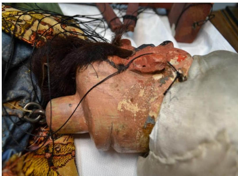
Figura 3 – Detalle del estado de conservación de la marioneta del Rey Basilio usada para la representación de “El retablo de Maese Pedro” en la que se aprecia en parte trasera de la cabeza restos de adhesivo y pérdida de sucesivos estratos policromos © Museo Nacional del Teatro. Fotografía: Raquel Racionero.

oxidación de elementos metálicos de agarre presentes en la cruceta etc. A estos factores de deterioro debemos añadir los factores de deterioro intrínsecos relacionados con la composición y la naturaleza de los materiales, en su mayoría envejecidos e incompatibles desde la creación de estos bienes. Finalmente ante acciones específicas tales como la manipulación o el almacenamiento inadecuado en ambientes no controlados (al tratarse de piezas que no siempre quedan adscritas a un área determinada), plantean la necesidad de implantar protocolos y planes de conservación adaptados a estos conjuntos patrimoniales. Tras la evaluación del estado de conservación de este patrimonio, el conservador-restaurador, recopilando toda aquella información aportada por parte de los agentes activos participantes tales como propietarios, manipuladores o creadores, iniciara la toma de decisiones para aplicar una serie de medidas concretas para la preservación del bien.