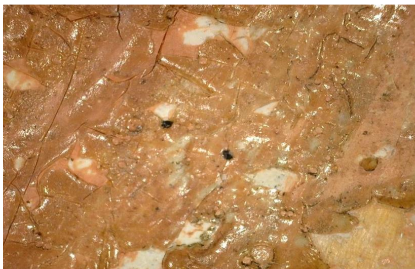
Figura 4 – Detalle macrofotográfico de la carnación en la parte trasera de la marioneta del Rey Basilio en la que se aprecia restos de adhesivo y pérdida de sucesivos estratos policromos

Es en este punto donde toma importancia la conservación curativa. La conservación curativa o restauración queda definida como aquellas acciones aplicadas directamente sobre un bien cultural aparentemente frágil o que muestra un rápido deterioro que pone en riesgo su consistencia y posible lectura. Es necesario conocer que todos los tratamientos de restauración modifican de una manera u otra la apariencia física y estética del títere, afectando al mensaje que quiere mostrar. Por esto debemos ser conocedores de que la realización de tratamientos tales como el asentado de la policromía, la consolidación textil en la zona de desgarros y rotos, o la reposición de piezas etc., pueden solucionar un problema concreto pero desvirtuar la atención, la estética y finalmente el contenido.