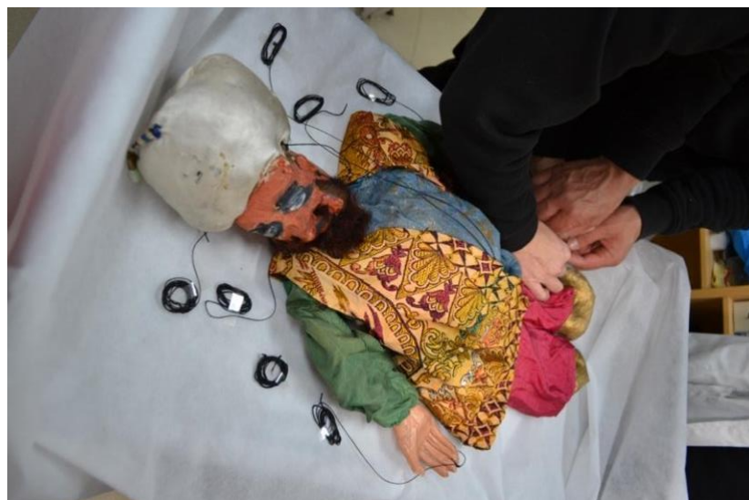
Figura 5 – Proceso de manipulación de las partes esenciales de la marioneta del Rey Basilio durante el proceso de colocación de la figura,desentramado de los hilos y el aparato de mando para evitar puntos de tensión y roturas en las zonas de enganche.