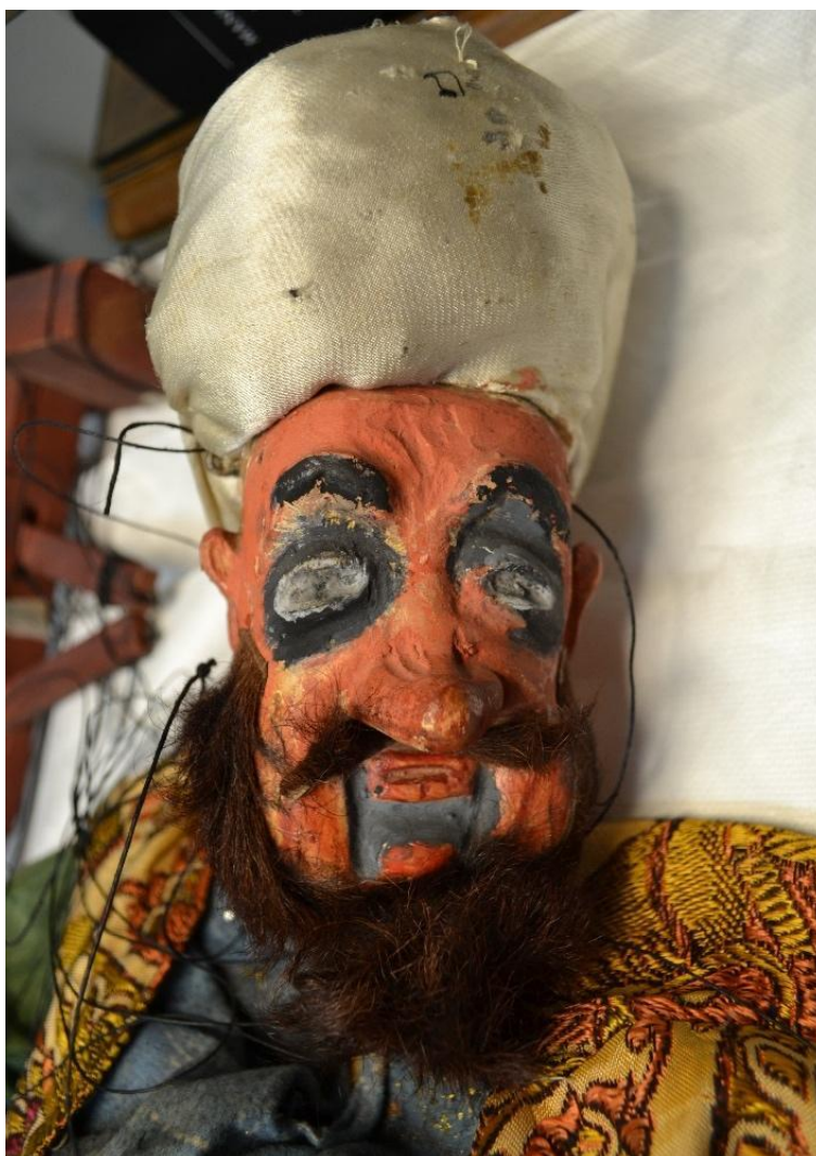
Figura 1 –Títere de hilo correspondiente al Rey Basilio perteneciente al “Retablo de Maese Pedro” donde se muestra el estado de conservación de la cabeza y el turbante.

Universidad Complutense de Madrid (Madrid, España)