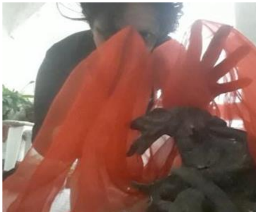
Figura 2 –Extraída de un ensayo virtual, abril de 2020. Tormenta de Lagartos