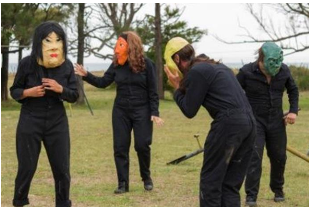
Figura 5 – Salida a la plaza, noviembre del 2020. Realizada por Daiana Méndez

¿Decimos qué? ¿Qué dice lo que hacemos? ¿Qué queremos decir? ¿Para quién? ¿Cómo lo decimos? ¿Por qué decimos esto? ¿Para qué? ¿Sólo es para escapar? ¿Es solo entretenimiento?