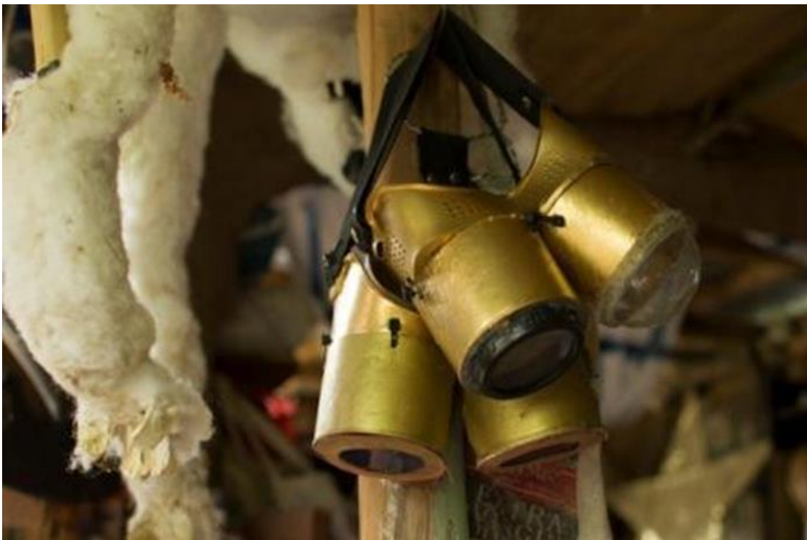
Figura 1 –Trabajo con las materias, Octubre 2020.

Tormenta de Lagartos. (Salinas, Uruguay)