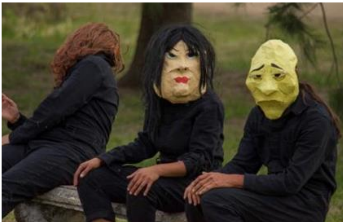
Figura 6 – Salida a la plaza, noviembre del 2020. Realizada por Daiana Méndez