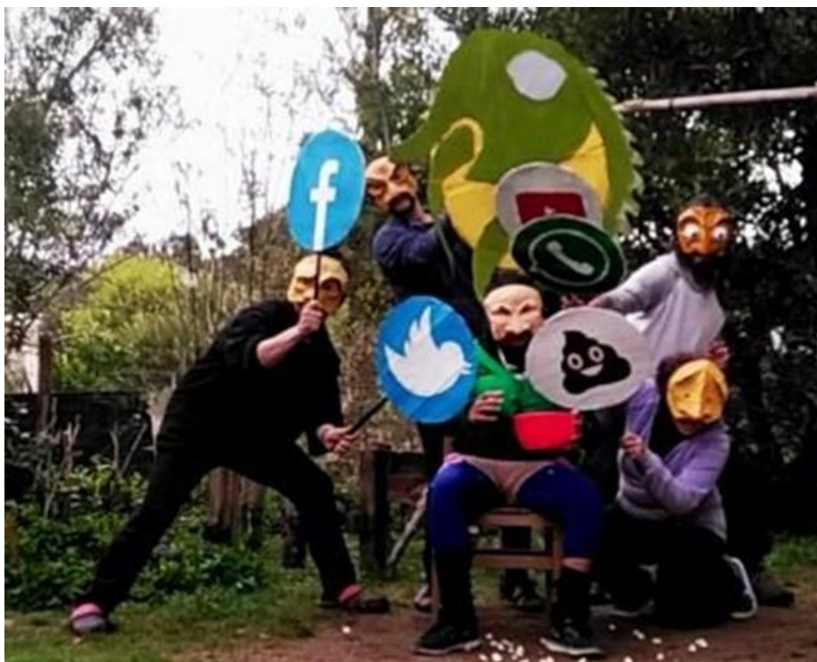
Figura 3 –Ensayo presencial con máscaras de práctica, Setiembre del 2020. Realizada por Tormenta de Lagartos

Los juegos realizados con estas máscaras, propiciaron la construcción de las máscaras definitivas, que constituyen mayor definición de personaje con un gesto fijo, basadas en dibujos de estilo cómic realizados por Leandro Moura 20 , hechas con un mismo material de elaboración pero con el agregado de un casco completo para la cabeza, detalles en la terminación como pelucas, que le dan más definición a los personajes. Inicialmente fueron máscaras blancas y luego las pintamos con colores asociados a la emoción propia de cada personaje. Esto nos significó un aprendizaje por ensayo y error, así como la aceptación de que hay elementos que hay que abandonar.