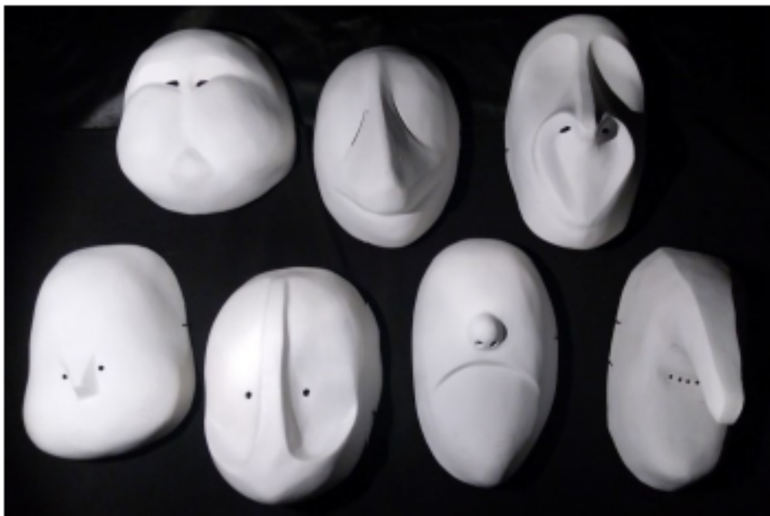
Figura 1 – Máscaras larvárias criadas por Daniele Viola.

Universidade Federal de Santa Catarina – UFSC (Florianópolis, SC)