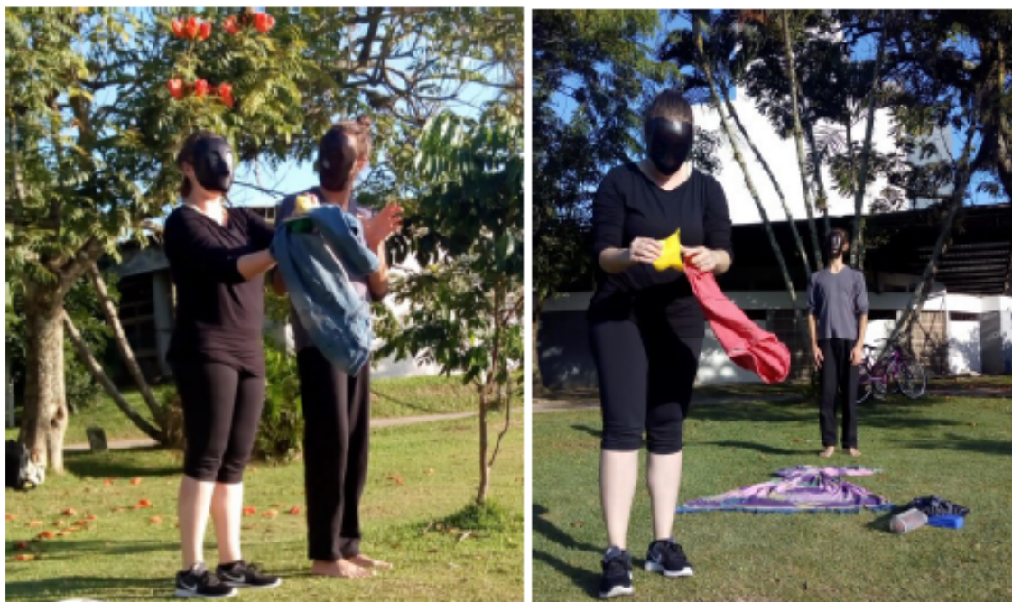
Figura 7 – Experimentações com a nossa máscara neutra.

os objetos e com os espaços pôde ser entendida através de um movimento maior com o olhar e menor com a máscara em si.