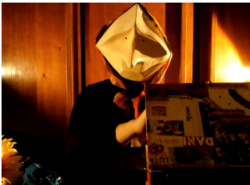
Figura 10 – Experimentação com a máscara larvária.

O nosso processo, desenvolvido especificamente com estas máscaras, procura analisar a estética desses objetos e a visualidade singular de cada uma dessas máscaras, como por exemplo a Figura 10. Algo ainda mais belo, é que cada pessoa vai ler e interpretar a máscara em seu corpo de uma forma diferente. Segundo Viola (2016, p. 29), a “experiência em função do ambiente acontece por meio do olhar, que em cada um traz uma perspectiva diferente da que temos sobre os objetos e os espaços, que juntos formam um sistema”, assim, é uma maneira de contarmos nossas histórias pelo nosso corpo, de materializar as imagens e significados dos signos que interpretamos.