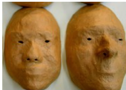
Figura 4 (esquerda) – Máscara Neutra confeccionada por Amleto Sartori. Fonte: O Corpo Poético (LECOQ, 2010, p. 70) e Figura 5 (direita) – Máscaras neutras criadas em aulas na UFSC. Fonte: Arquivo pessoal.

Visualmente, as máscaras são bem diferentes, mas será que isso iria interferir no momento do jogo cênico? Então, confeccionamos máscaras que apresentassem essas diferenças nos olhos e boca, para podermos experimentar as variações destas possibilidades expressivas. Norteamos-nos por questões referentes às percepções das atrizes vestindo essas máscaras e das atrizes