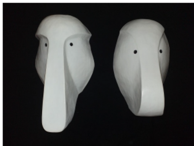
Figura 8 (esquerda) – Máscaras larvárias criadas por Daniele Viola, e Figura 9 (direita) – Máscaras larvárias criadas por Laura W. Gedoz.

A máscara larvária, na nossa perspectiva, compreende uma ecologia cênica, visto que ela é também um elemento visual e está em diálogo com vários outros. Por isso que, ao passo que utilizamos sua forma para desenvolver um corpo a favor do jogo, o conjunto do corpo-máscara irá compor com o espaço,