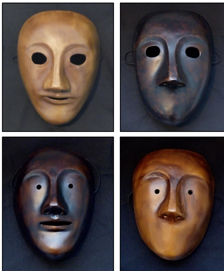
Figura 6 – Máscaras neutras criadas por Daniele Viola.

Essa vivência nos trouxe algumas percepções: nas máscaras com abertura pequena dos olhos , as atrizes sentiram-se mais confortáveis e a técnica da triangulação pareceu ser mais eficiente e precisa. Elas apresentaram mais calma na movimentação, paciência e cuidado com o deslocamento no espaço. Isso pode ser atribuído a uma limitação do campo de visão.