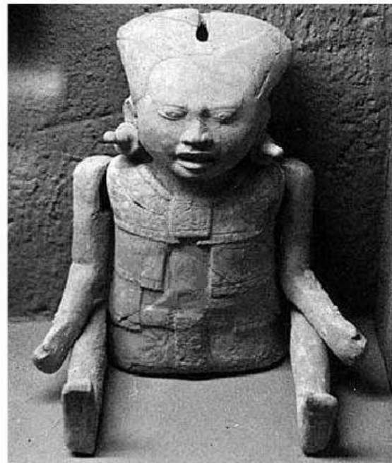
3) Figurilla articulada totonaca. Museo Rufino Tamayo, México.

Estas figuras de barro articuladas –representaciones de la forma humana– han sido encontradas en los sitios arqueológicos correspondientes a las culturas Maya, Totonaca, Teotihuacana, Tlaxcalteca, Cholulteca y Mexica, entre otras. Datan a partir del año 300 d. C. y son muñecos hechos de barro –casi todos– de 6 a 35 cm de altura, con los brazos y/o piernas independientes del cuerpo, pero unidos al mismo con fibras naturales que les da