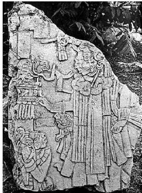
6) Estela maya, muestra un muñeco de pulsera (Chinkultic, México).

En la otra mano lleva una figura, del mismo tamaño que la anterior, en forma de ave con