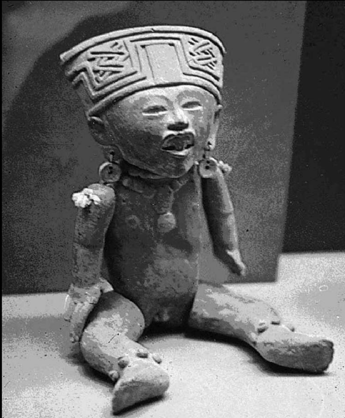
Figurilla articulada totonaca. Museo Regional de Antropología, México.

Daniel Alejandro Jara Villaseñor Títeres Tiripitipis (México - Venezuela)