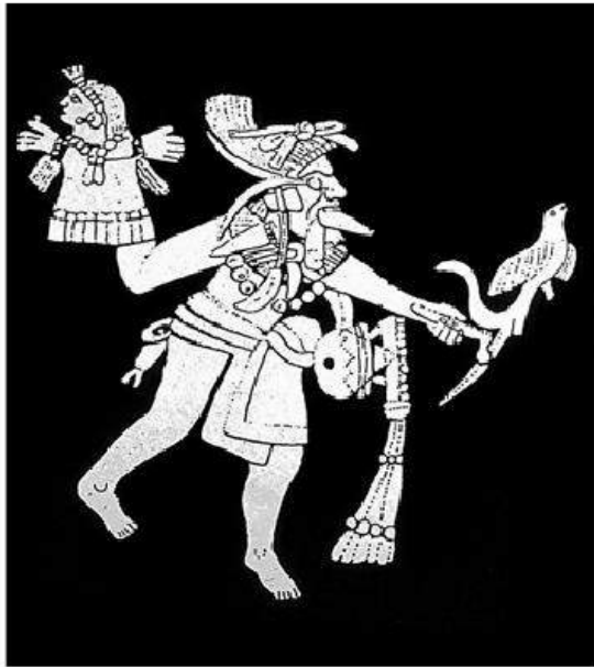
5) Detalle del Titiritero de Bilbao (Santa Lucía Cotzumalhuapa, Guatemala).

las alas abiertas, que se diría quisiera expresar cierto movimiento. La escena está enmarcada por otros pájaros, además de una persona en posición sedente y de algunos extraños objetos con rasgos antropológicos. En la parte central del monumento, está representada una figura humana que casi duplica de tamaño a la que hemos descrito.