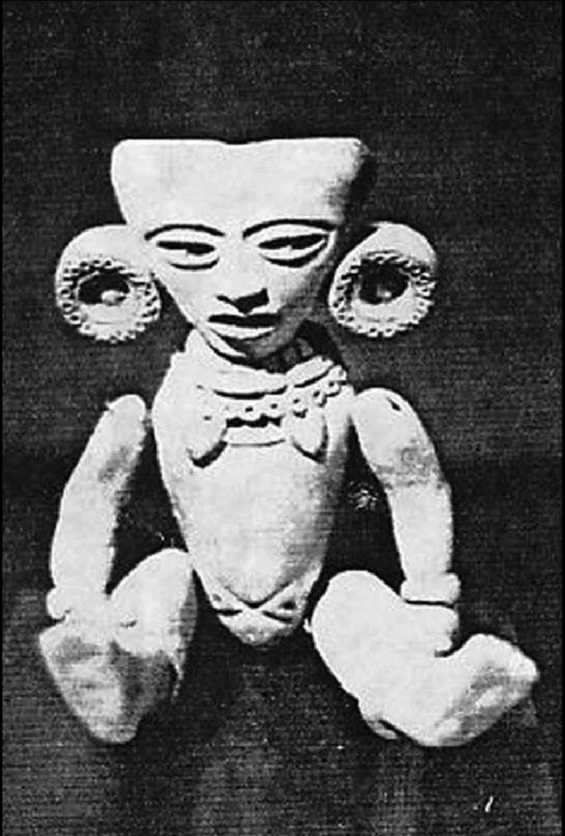
Figurilla articulada de la cultura teotihuacana. Museo Nacional de Antropología, México.