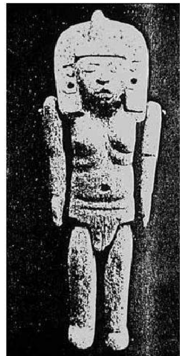
4) Figurilla articulada huasteca (Tampico, México).

En un manuscrito que Sahagún no utilizó en sus principales obras y que quedó