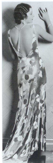
Figura 5: Vestido com costas desnudas