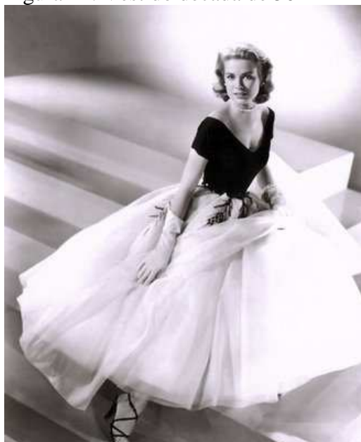
Figura 14: Vestido década de 50

Nos anos de 30 à 50 as especificações do que usar e como usar eram ditadas pelos grandes estilistas e casas de costura, contudo com a revolução jovem (século XX) a moda do século XXI chega com multiculturalidade e diversificação, sendo englobada em um supermercado de estilos , voltando a escolha ao indivíduo e sua personalidade, entrando em foco a customização e conseqüentemente a tribalização , como já relatado, surgida da homogeneização da coletividade aliada a identidades individuais e sociais plurais. Portanto, no novo milênio, houve uma inversão de valores, existindo múltiplos pontos de tendências, muitas dessas ditadas pela rua. “A ‘ditadura da moda’ é um conceito que alcançou seu ápice nos anos 50 e lá se cristalizou” (PALOMINO, 2003, p.18).