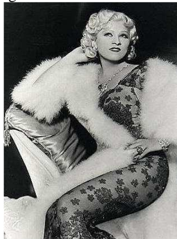
Figura 4: Mae West