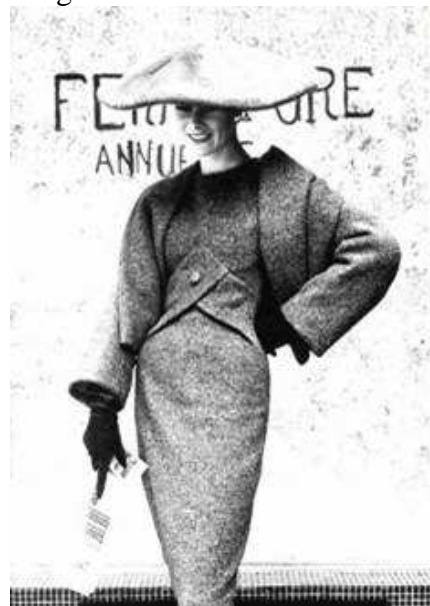
Figura 12: Linha Y