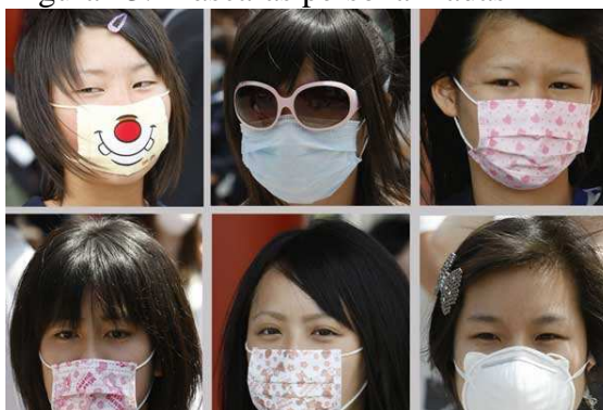
Figura 13: Máscaras personalizadas

A mudança do século fez a moda reinventar-se através de dois conceitos. Um deles é a customização, que se baseia na intervenção do usuário em sua roupa, com objetivo da obtenção de uma personalidade própria, se diferenciando dos demais.