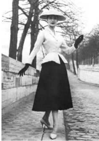
Figura 8: New Look

(1989) começa o New Look de Dior, que inicialmente deixou a Câmara de Comércio Britânica furiosa, pois ainda faltava matéria-prima e outros elementos para a confecção de peças de vestuário na Inglaterra. Mesmo considerada frívola para o momento em que se passava, as mulheres apertavam-se em cintas para entrarem no novo look da moda. Nos dez anos seguintes a moda teve intensa agitação.