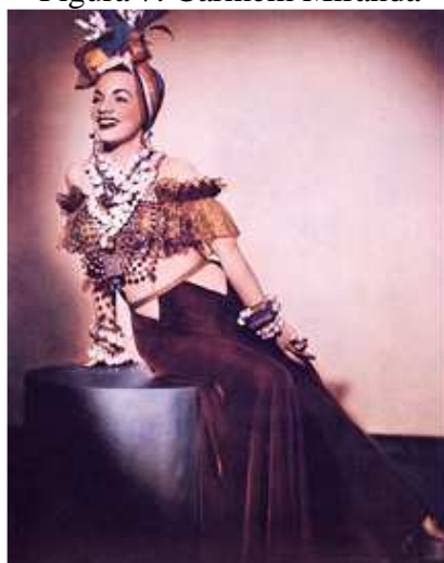
Figura 7: Carmem Miranda

“Nos Estados Unidos não houve tantas restrições como na Europa, razão pela qual a moda lá se desenvolveu seguindo mais de perto as linhas anteriores à guerra” (EMBACHER, 1999, p. 49), desenvolvendo uma maneira totalmente nacional, voltada ao mercado de massa, iniciando uma diferenciação do gosto europeu. Durante o conflito, a Inglaterra e a França resolveram reestruturar e desenvolver suas próprias indústrias de moda. Nesta década “tudo o que não era europeu entra em voga. A América do Sul vira moda, Carmem Miranda alcança grande projeção. O prêt-à-porter marca presença no final da guerra, e a roupa é produzida em série” (EMBACHER, 1999, p. 50).