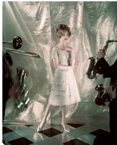
Figura 10: Linha A