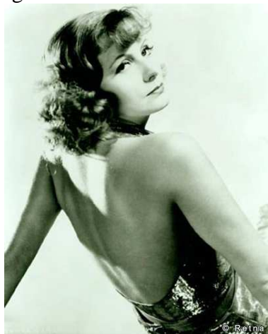
Figura 3: Greta Garbo