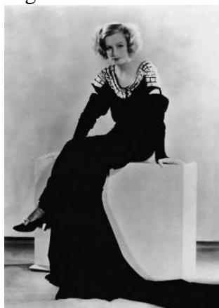
Figura 2: Greta Garbo