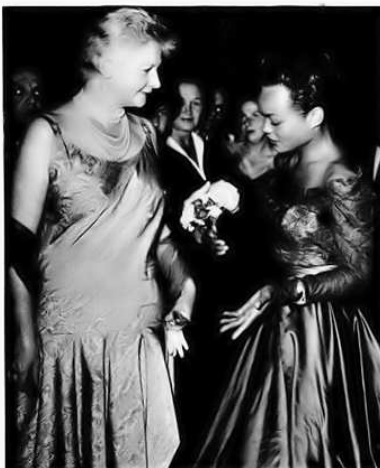
Figura 9: Flat-look

❏ Dior 'Flat Look' Puzzles Eartha: Shapely Eartha Kitt quizzically studies flatted figure of New York radio star Pegeen Fitzgerald, who showed up in latest Dior dress style at New York premiere of The Egyptian . Eartha was in New York to begin rehearsals on new play, Mrs. Patterson .