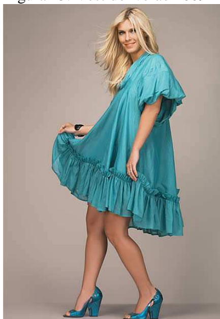
Figura 15: Vestido verão 2009