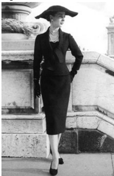
Figura 11: Linha H