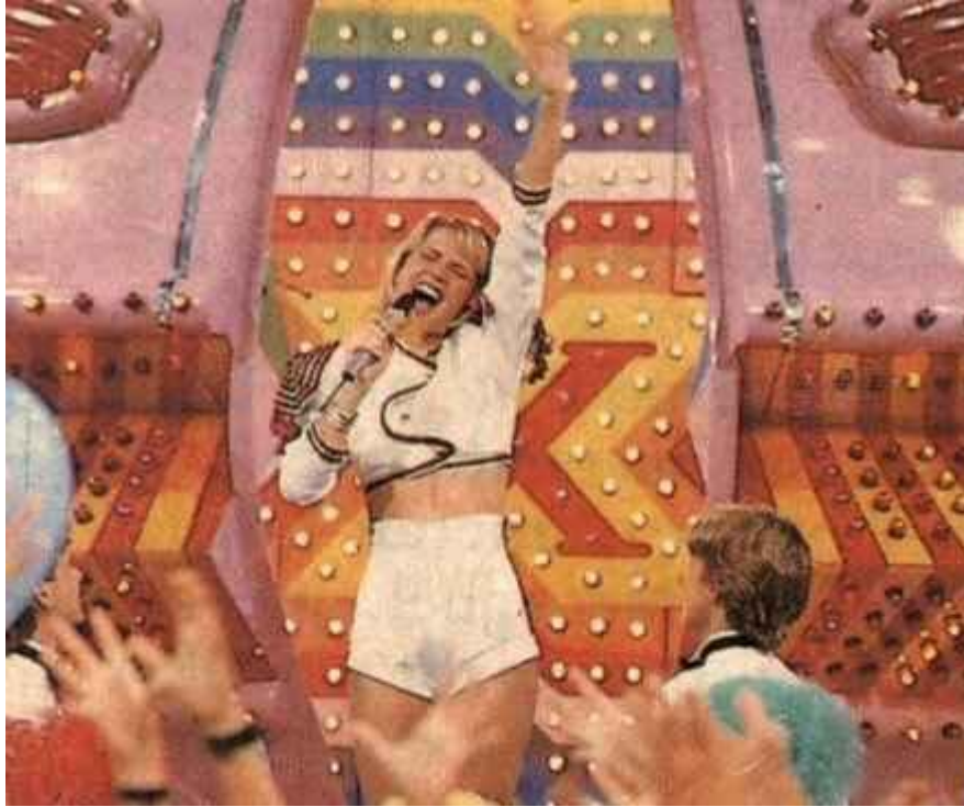
Figura 1. Chegada da apresentadora Xuxa no Xou da Xuxa