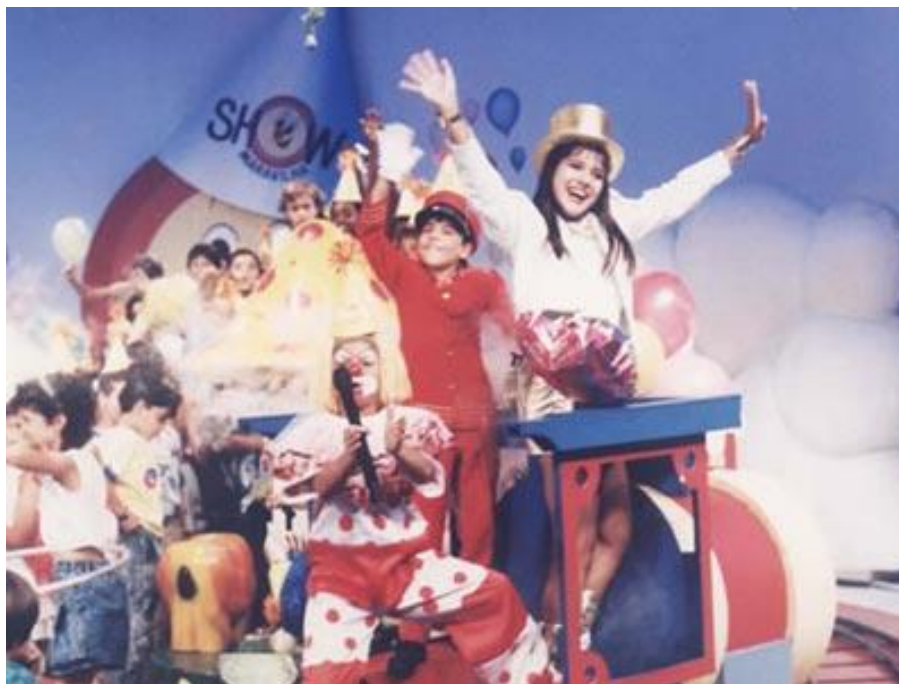
Figura 3. Chegada de Mara Maravilha ao Show Maravilha