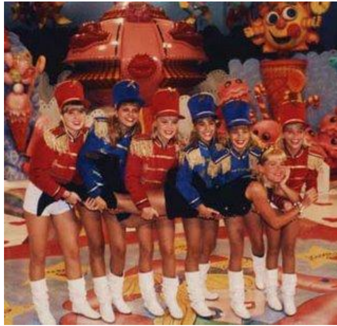
Figura 4. Xuxa e Paquitas