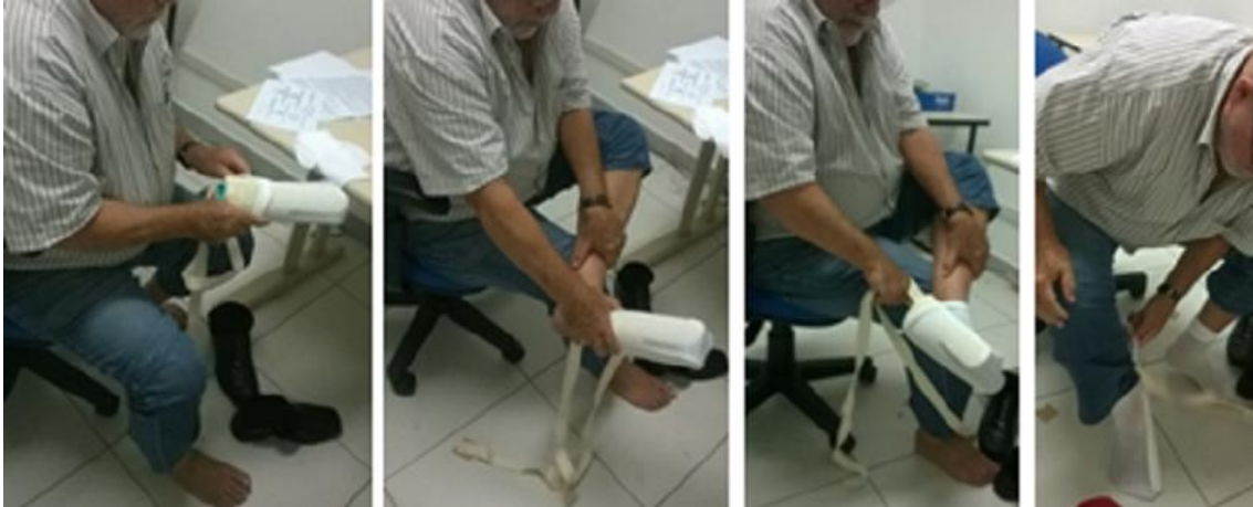
Figura 8: Participante 4 realizando a tarefa de vestir o par de meias utilizando o dispositivo avaliado