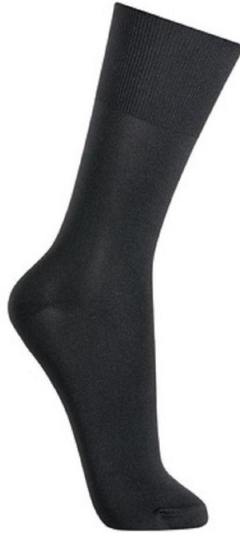
Figura 4: Modelo de meia utilizada nos testes