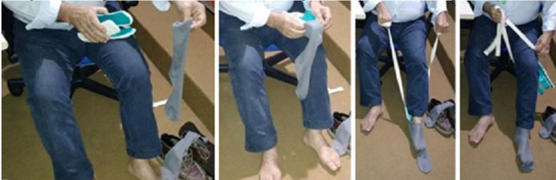
Figura 5: Participante 1 realizando a tarefa de vestir o par de meias utilizando o dispositivo avaliado

Esse participante não conseguiu vestir corretamente a meia, conforme pode ser visto na Figura 5. Uma de suas sugestões foi fazer o folheto de instruções de uso com fotos de pessoas utilizando o produto e pequenas legendas. Seu principal problema em relação às instruções foi no passo número um, o qual, segundo ele, deveria ter uma figura mais clara, pois “está muito complicado”. O tempo total do teste foi aproximadamente 40 minutos, e o tempo utilizado para vestir o par de meias foi aproximadamente 6 minutos.