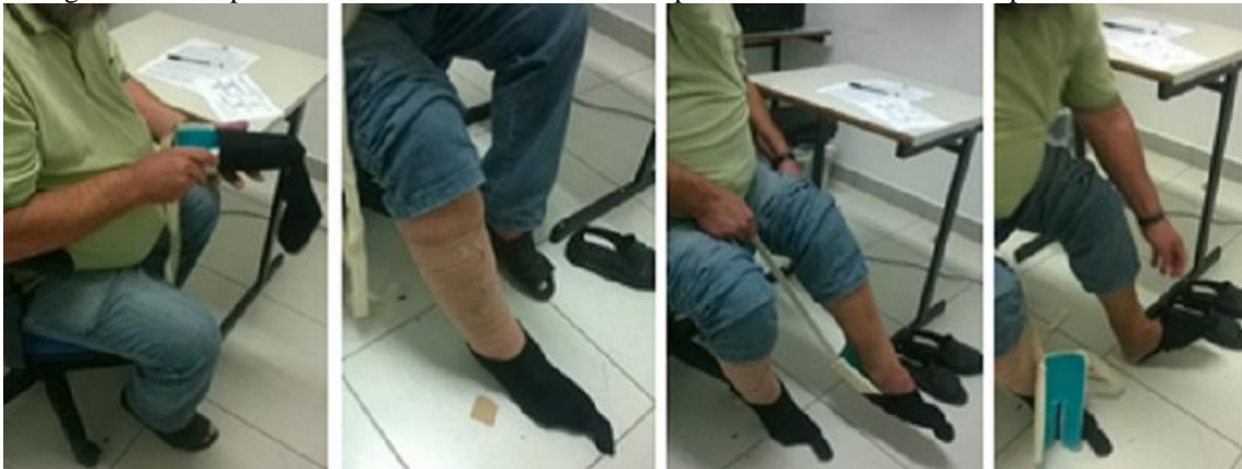
Figura 6: Participante 2 realizando a tarefa de vestir o par de meias utilizando o dispositivo avaliado

Este idoso, assim como o participante 1, sugeriu que o folheto de instruções seja feito com fotografias de uma pessoa utilizando o produto. Segundo ele, “a ideia é boa, mas tem que fazer funcionar”. Na Figura 6 pode-se ver a realização da tarefa pelo participante 2, o qual utilizou aproximadamente 35 minutos para realizar todo o teste e aproximadamente 11 minutos para vestir o par de meias.