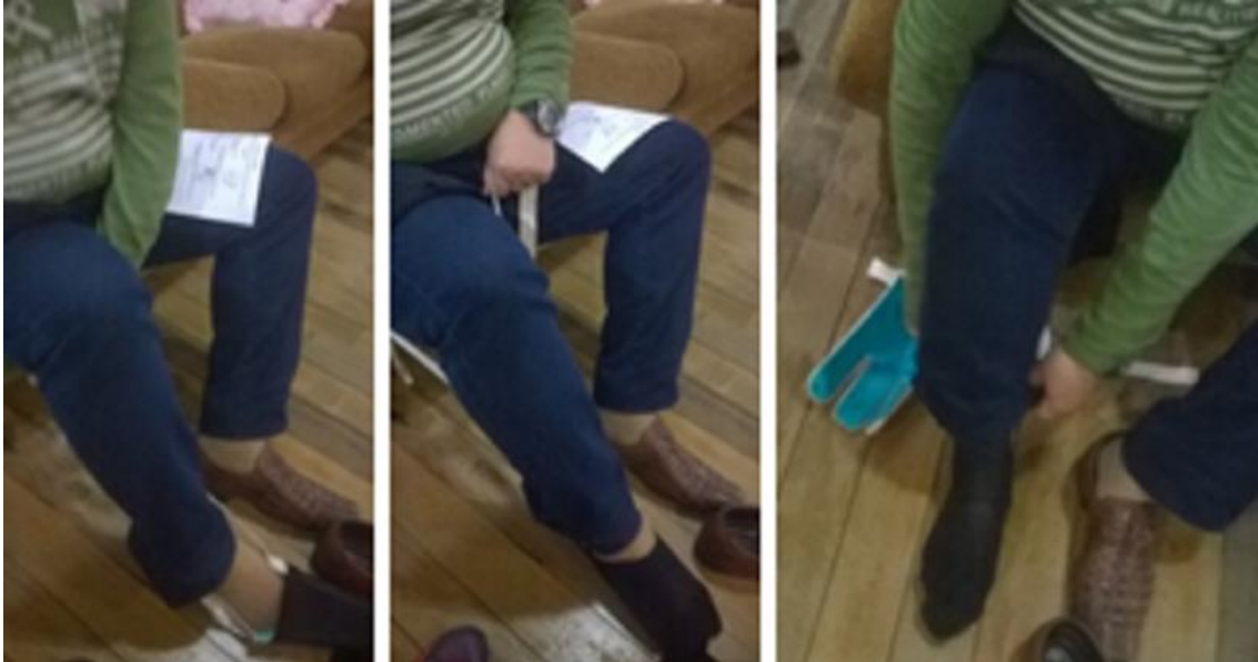
Figura 7: Participante 3 realizando a tarefa de vestir o par de meias utilizando o dispositivo avaliado

O tempo total do teste com o participante 3 foi bastante inferior aos anteriores: 4 minutos para vestir o par de meias e 10 minutos para realizar todo o teste, aproximadamente. Na Figura 7, são apresentados os registros desse teste, nos quais é possível perceber que o participante não conseguiu vestir as meias de forma completa com a utilização da Adaptação.