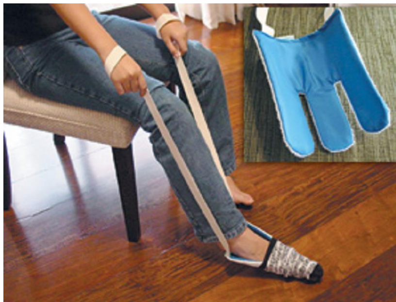
Figura 1: Demonstração de uso da adaptação para colocar meia