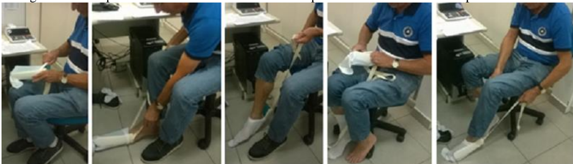
Figura 9: Participante 5 realizando a tarefa de vestir o par de meias utilizando o dispositivo avaliado

O participante 5, com 62 anos de idade, conseguiu utilizar o dispositivo com facilidade, sendo que para vestir o par de meias foram necessários pouco mais de três minutos. Ele afirmou após responder ao questionário de avaliação do uso que o produto é bom, bem prático. A Figura 9 apresenta a realização do teste com o participante 5, que teve duração total de 15 minutos.