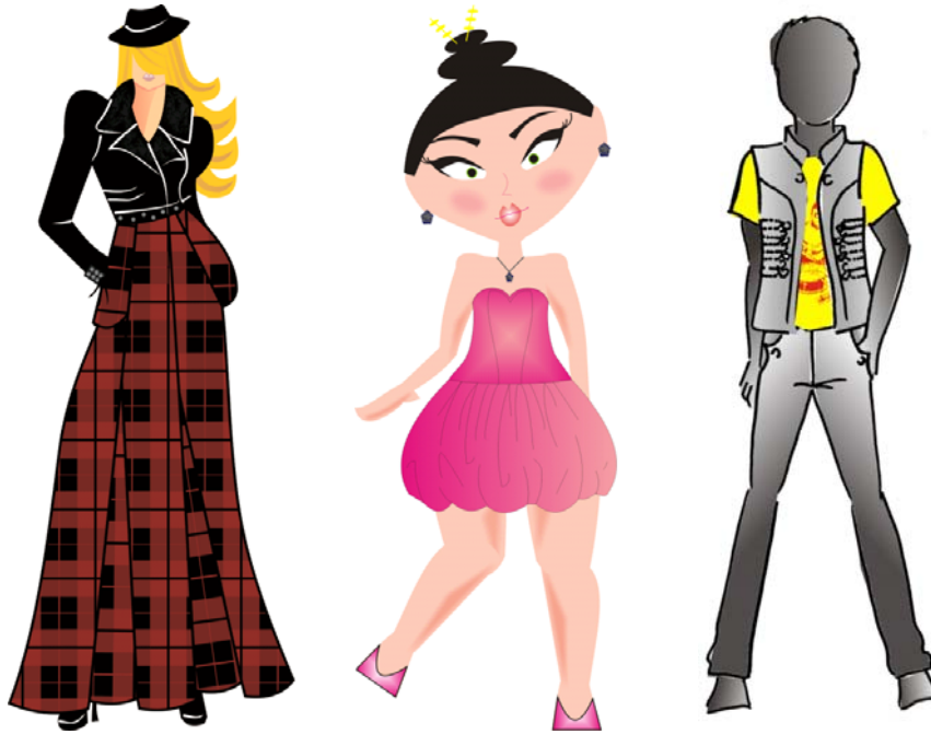
Figura 1 – Ilustrações vetoriais

específicos como o CorelDRAW e o Illustrator que, normalmente, produzem desenhos “chapados”, resultando em ilustrações notadamente digitais.