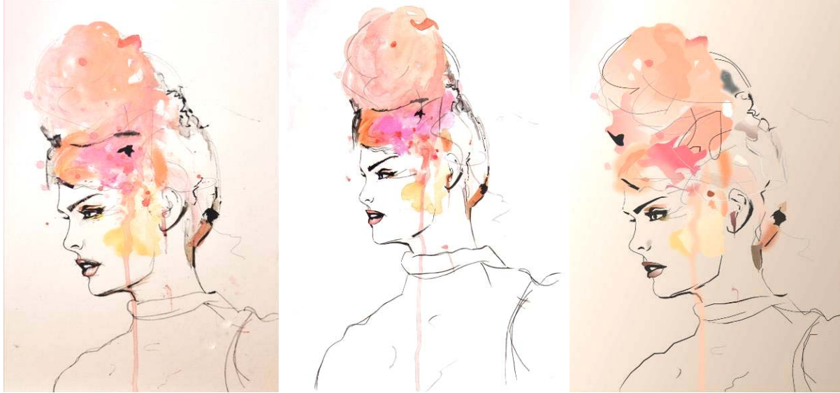
Figura 2 – Trabalho interdisciplinar (ilustração sugerida: Leigh Viner + desenho manual em aquarela + desenho digital (100% vetor))

Fica claro para o discente que, independente da maneira escolhida para representação, ambas retornam excelentes resultados, mas, não se constroem sozinhas. Tudo depende de sua total interação junto às ferramentas de trabalho.