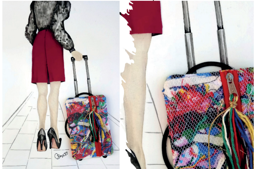
Figure 6. The comings and goings. Illustration on paper with textile collage and overlay of fabric built with waste