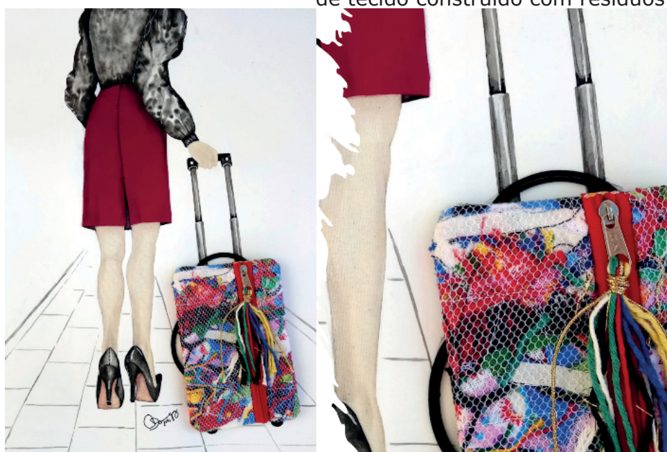
Figura 6. As idas e vindas. Ilustração sobre papel com colagem têxtil e sobreposição de tecido construído com resíduos.