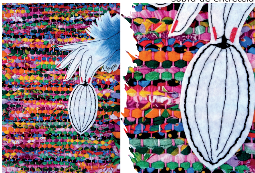
Figura 5. Entre tramas. Ilustração com sobreposições de têxtil artesanal e bordado em sobra de entretela.