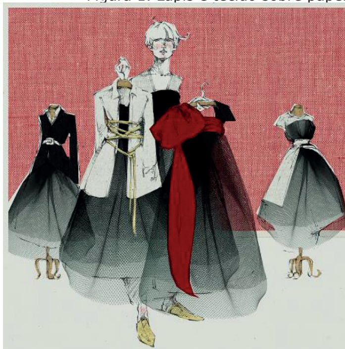
Figura 1. Lápis e tecido sobre papel.