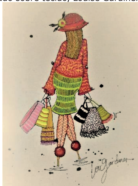
Figura 2. Bordado sobre tecido, Louise Gardiner.