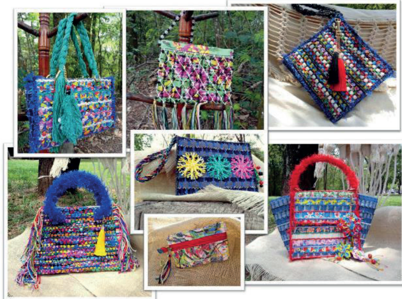
Figura 3. Coleção de bolsas Cores de Chita desenvolvidas com resíduos têxteis.

novamente utilizados no desenvolvimento de um novo tecido, que produziu novos produtos.