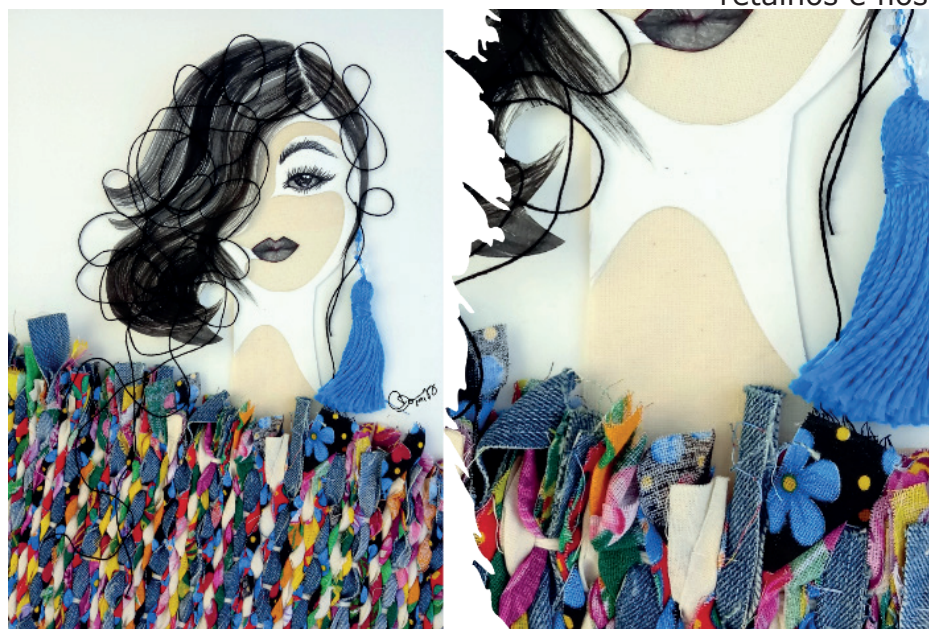
Figura 4. Vestida de sonhos. Ilustração com sobreposições de papel e têxtil artesanal, retalhos e fios.

Ao considerar o aspecto físico e material das ilustrações, algumas observações são fundamentais para efetivar o processo e alcançar o resultado pretendido. Por se tratar de um trabalho que utiliza papel, tecido, fios e técnicas gráficas com aguadas de tinta, as técnicas têxteis são introduzidas na ilustração após sua configuração gráfica finalizada.