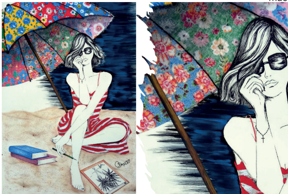
Figura 7. Paleta. Ilustração sobre papel com colagem de resíduos têxteis e bordado à mão.