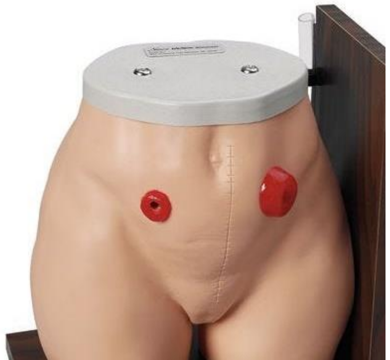
Figura 1. Simulação de ostomias

trânsito normal da alimentação e/ou eliminações”. O ostoma pode ser de três tipos distintos: (I) colostomia; (II) ileostomia; e (III) urostomia. A colostomia consiste em uma ostomia digestiva do intestino grosso; já a ileostomia resume-se em uma ostomia digestiva do intestino delgado; e a urostomia pode ser compreendida como uma ostomia do trato urinário. Faz-se interessante considerar que a abertura do ostoma pode ser feita do lado direito ou esquerdo do abdômen (Figura 1).