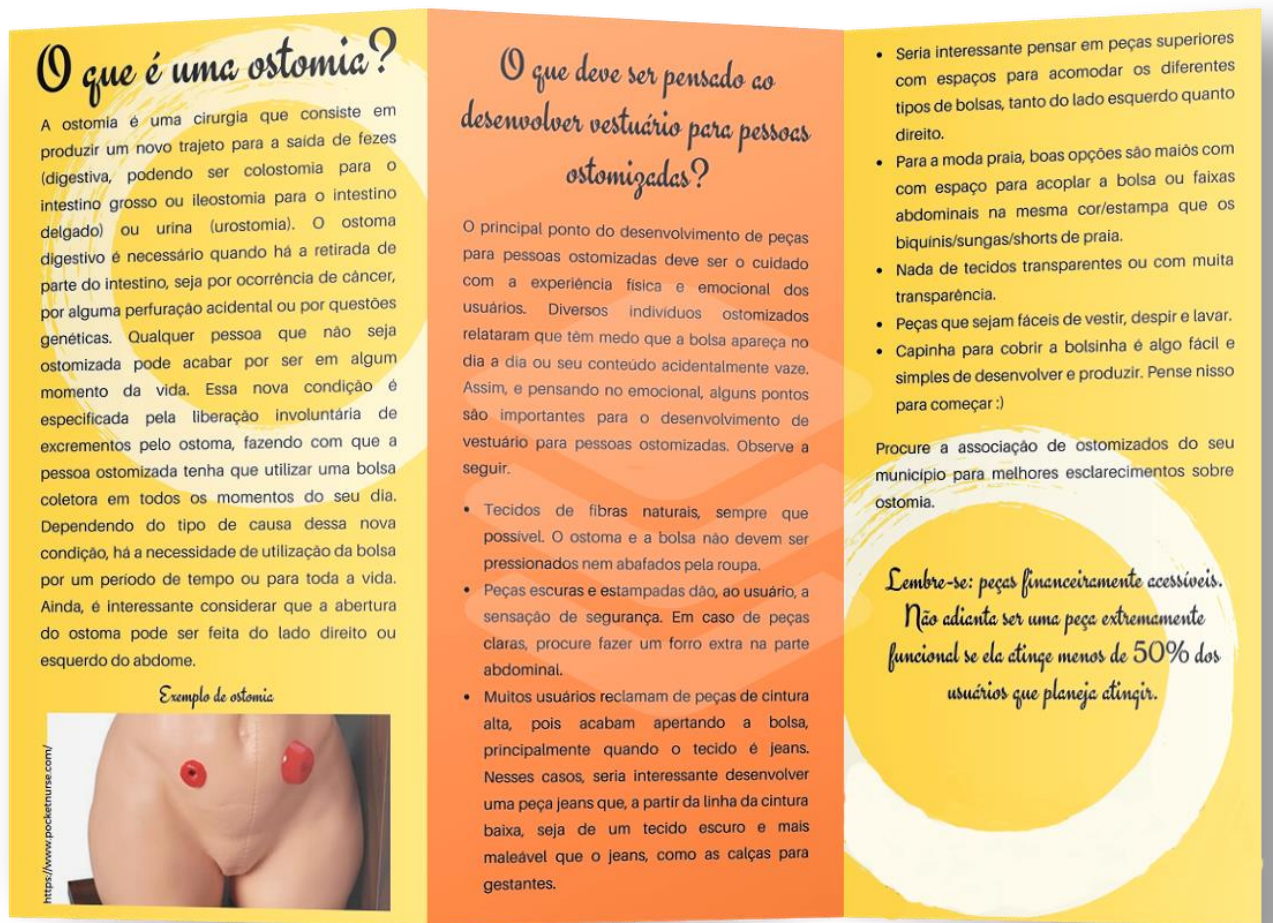
Figura 4. Estrutura preliminar da cartilha para o desenvolvimento de vestuário para pessoas ostomizadas