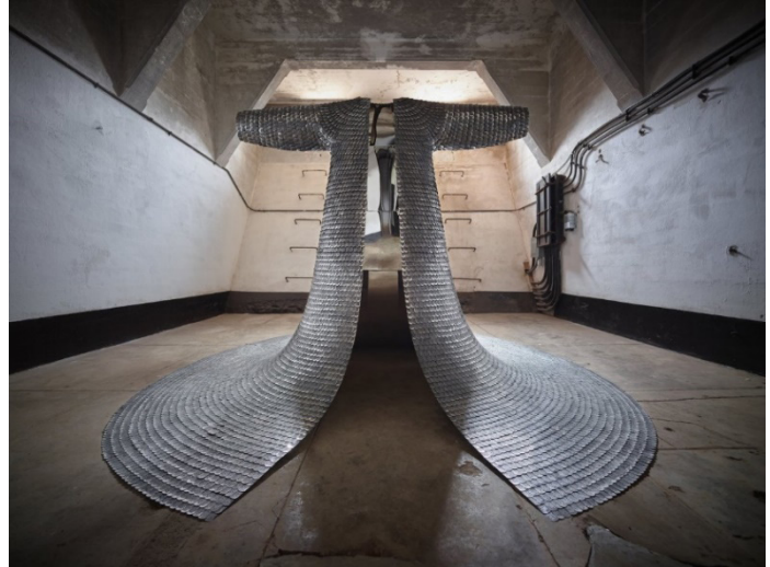
Figura 3. Escultura Some/One do artista Do-Ho Suh