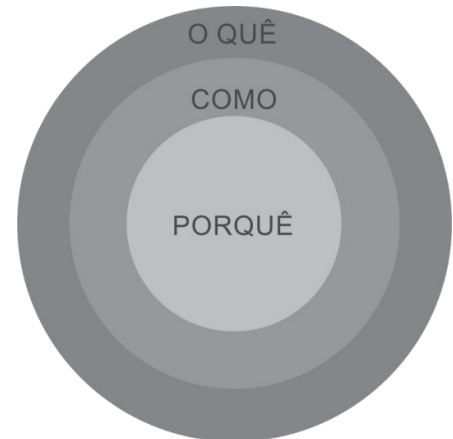
Figura 5. Golden Circle (Círculo de Ouro)