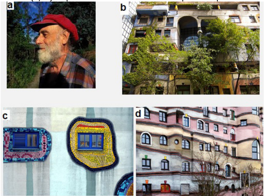
Figura 1. Friedensreich Hundterwasser (a) e as fachadas de seus prédios inspirados na natureza (b), cujas janelas (c, d) expressavam a identidade da pessoa que ali vivia