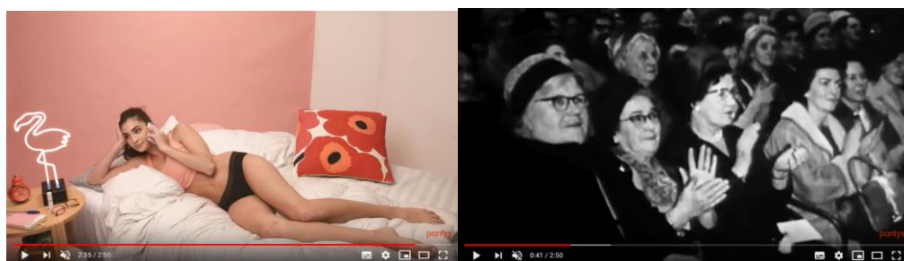
Figuras 8 e 9: Cenas coloridas vs. cenas em preto-e-branco.

No vídeo, é possível observar a oposição Novo vs. Velho do plano do conteúdo sendo reiterada no plano da expressão por meio do contraste plástico em cenas coloridas vs. cenas em preto-e-branco.