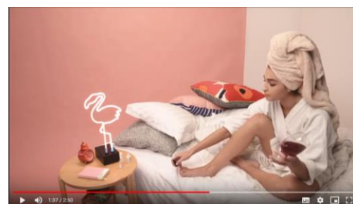
Figura 7: Taça de vinho.

Um elemento que aparece diversas vezes ao longo do vídeo é a taça de vinho, em alusão ao sangue menstrual. Um momento que se destaca é quando o narrador está se referindo ao vazamento de menstruação: “Pode vazar? Bom, é muito importante que você conheça o seu fluxo. Se você ficar aí no mundo da lua, ficar distraída e deixar ultrapassar... Ei, cuidado, menina! Vai derrubar tudo!” e a personagem quase derrama o vinho na cama, como demonstrado na figura 7.