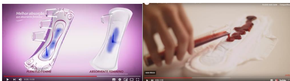
Figuras 5 e 6: Propaganda tradicional de absorvente utilizando líquido azul. Cena do vídeo da Pantys utilizando líquido vermelho.