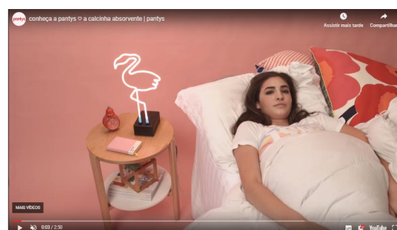
Figura 1: Vídeo institucional da marca Pantys