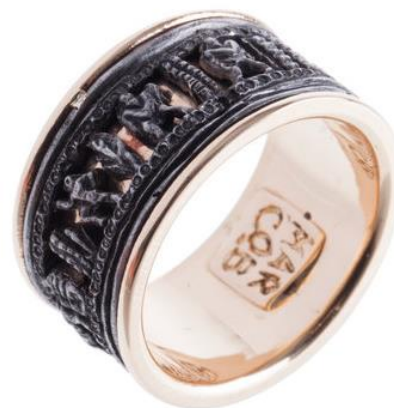
Figura 4: Anel de ferro e ouro inspirado na vida romana

Como foi dito, a ourivesaria do toscano representa a temática da arte antiga italiana com visão na tendência atual da moda, o binômio arte-moda, como é visualizada na Figura 4 com anel sobre a vida romana retratada em obelisco.