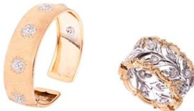
Figura 5: Bracelete e anel inspirado em Florença