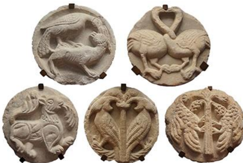
Figura 2: Serie Fornelle do Museu Stefano Bardini