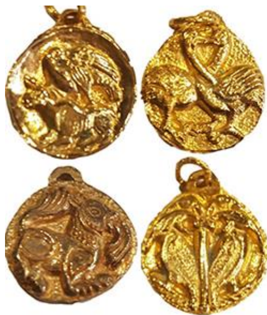
Figura 6: Jóias inspiradas na Série Fornelle do Museu Stefano Bardini

forma circular das esculturas rodas” (Swiechowski, 1982, pp. 23-24). Desse modo, percebe-se o cuidado de Marco Baroni adaptar o desenho ao formato proposto e produziu pingentes de ouro com os motivos da série Fornelle , nota-se, em algumas, que preservou exatamente o formato de como estão atualmente essas obras antigas. Ver Figura 6.