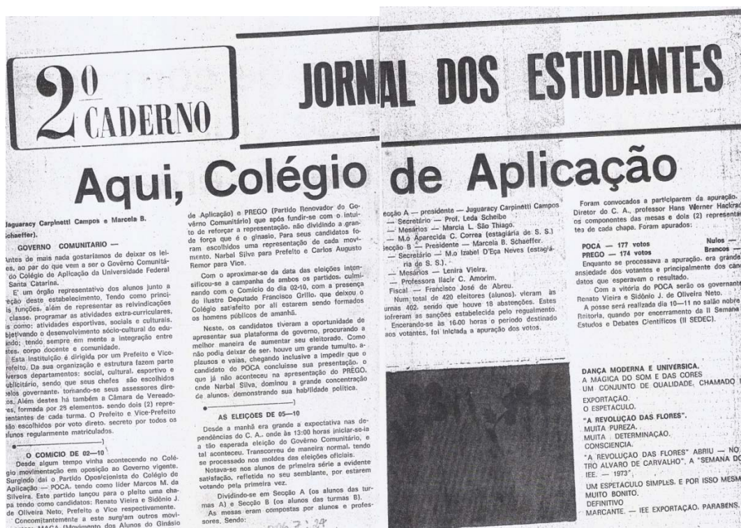
Figura 1 – Jornal do Estudante.

Com os jornais editados pelos alunos, seguia-se o mesmo princípio de regulação pela direção da escola. De forma correlata ao Governo Comunitário, a produção de jornais estudantis também reforça a necessidade de um capital cultural elevado para fazer parte de uma instituição como o Colégio de Aplicação da UFSC. Algumas das citações aqui utilizadas sobre o Governo Comunitário são do “Jornal dos Estudantes”, que noticiava os comícios dos alunos, o processo eleitoral, bem como entrevistava os candidatos e, mais tarde, os prefeitos eleitos.