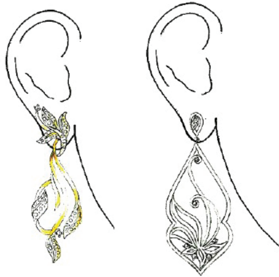
Figura 1 – Croquis para o projeto de brincos

pino de fixação e massa do brinco (STROBEL et al., 2013). Preuss (2013) destaca a importância de conhecer a anatomia da orelha para o projeto de um brinco confortável, contudo a orelha é tratada apenas em seu contorno geral simplificado (Figura 1) (GOLLBERG, ERIKSON e HARTY, 2010; MANCEBO, 2008; MASCETTI e TRIOSSI, 1999; PREUSS, 2013).