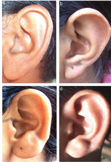
Figura 4 – À esquerda: formas da orelha externa: (a) oval, (b) triangular, (c) retangular, (d) redonda. À direita: formas da hélice: (a) normalmente enrolada, (b) larga, cobrindo a escafa, (c) reta, (d) côncava marginal. Fonte: Singh e Purkait (2009, p.465).