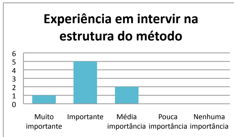
Figura 2 – Gráfico sobre a experiência do usuário em interferir na estrutura da metodologia, sob o ponto de vista discente.

metodologia não se integra com a necessidade do projeto. Assim, confirma-se a necessidade de um método ser flexível, permitindo a realização de interferências e adaptações em sua estrutura. Quando questionados sobre a experiência de uso do método aberto no projeto ergonômico de produtos, a maioria absoluta dos respondentes discentes afirmou que voltaria a utilizar o método aberto nos exercícios de projeto, mostrando sua aceitação, conforme mostra a figura 2.