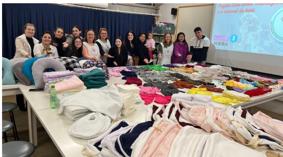
Figura 5 - Registros da participação de professores e estudantes na entrega para a Presidente e Voluntários da AVHRO

Fonte: Acervo da disciplina de Abex V Projeto de Moda, Julho de 2023.