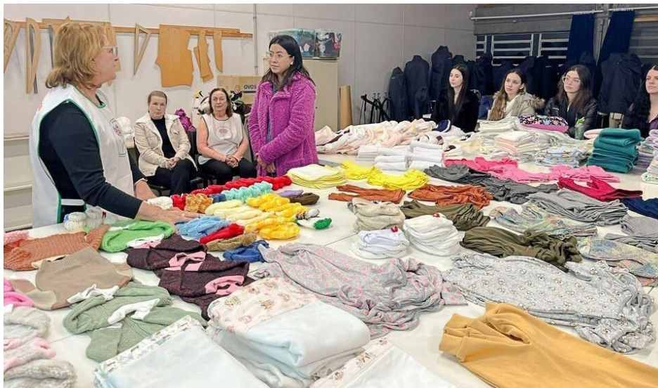
Figura 4 - Registros da Socialização de Resultados por Professores e Estudantes de Moda para Presidente e Voluntários da AVHRO