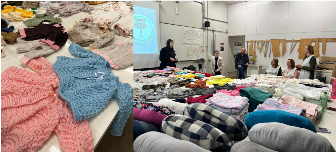
Figura 3 - Registros da Socialização de Resultados por Professores e Estudantes de Moda para Presidente e Voluntários da AVHRO