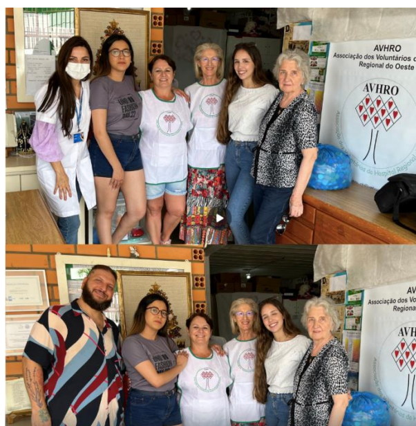
Figura 1 - Registros da visita de professores e estudantes de Moda na AVHRO