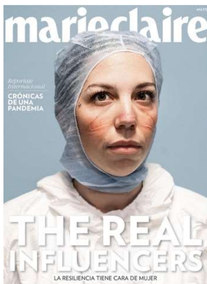
Figura 4 – A resiliência tem rosto de mulher.