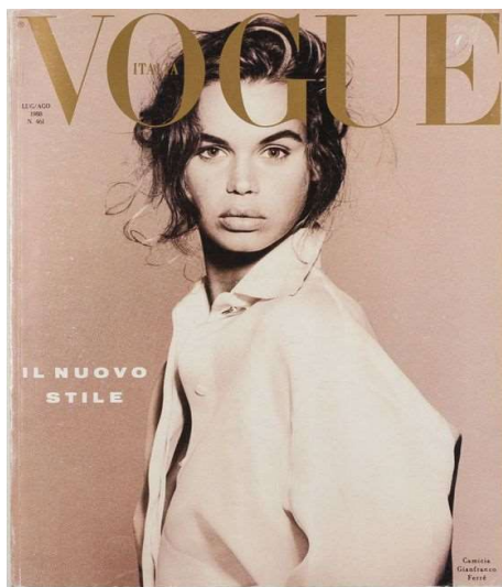
Figura 2 - Il Nuovo Stile .