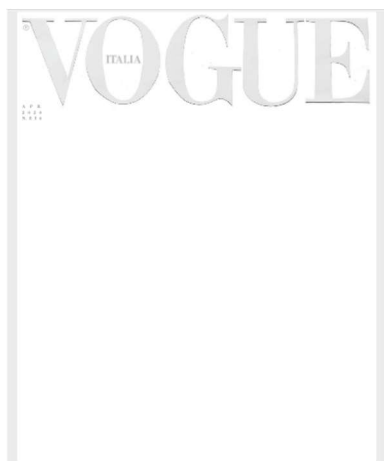
Figura 6 – Capa Branca.

Acima de tudo: o branco não se rende, mas uma folha em branco esperando para ser escrita, a página de título de uma nova história que está prestes a começar (FARNETI, 2020 apud VOGUE BRASIL, 2020).