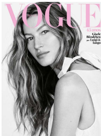
Figura 3 - Novo Normal.