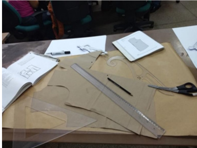
Figura 1: Modelo de bases de moldes e ferramentas utilizadas no laboratório.