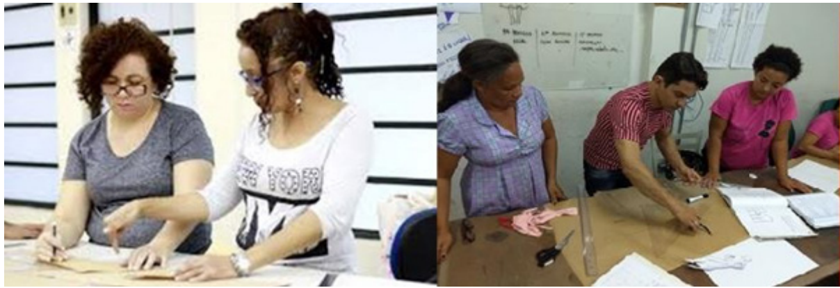
Figura 5: Professores e alunos em prática no laboratório.