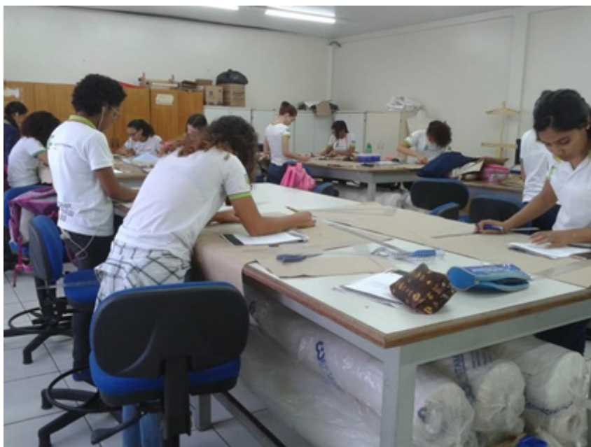
Figura 4: Alunos em laboratório experimentando os roteiros.

A fase inicial da pesquisa foi inteiramente realizada no reconhecimento das atividades laboratoriais nos campos do Instituto Federal do Piauí – IFPI, Campus zona Sul, sob a orientação de duas professoras da área técnica de modelagem e costura, e, da mesma forma, no Instituto Federal do Maranhão – IFMA, Campus São João dos Patos, sob a coordenação do professor da área de modelagem.