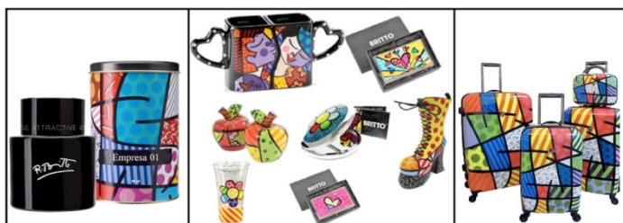
Figura 04: Produtos comercializados nas três empresas pesquisadas.

A imagem foi dividida em três quadros, o primeiro apresenta a embalagem do perfume comercializado na Empresa 01; seu rótulo foi alterado visando sigilo da marca. O quadro central demonstra alguns itens pertencentes ao mix de produtos da Empresa 02 e o terceiro quadro apresenta o jogo de malas revendido na Empresa 03.