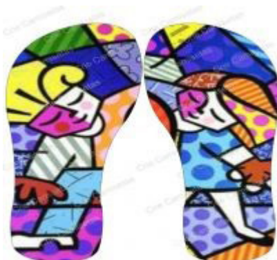
Figura 03: Produto comercializado nas três empresas pesquisadas