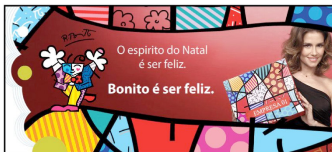
Figura 05: Peça de divulgação veiculada nas mídias online

Ainda de acordo com o primeiro objetivo específico, foi possível identificar similaridades entre as empresas em se tratando de aceitação e reconhecimento do público. Na Empresa 01 houve resultados positivos no período da campanha e de acordo com a entrevistada, o público conhecia o artista e consumia as embalagens que continham suas ilustrações. A funcionária da Empresa 02 explicou que são poucas as pessoas que não reconhecem os traços de Romero Britto e acrescentou “os clientes já chegam, querem o Romero Britto; que acham lindo, maravilhoso; ficam felizes que a gente tá trabalhando com o produto”. No entanto, identificou-se na empresa 03, que alguns clientes deixam de adquirir os produtos devido à falta de conhecimento sobre o artista e ao alto custo dos mesmos. O segundo objetivo específico buscou distinguir as ações dessas empresas em relação aos produtos com a arte de Romero Britto. Para a entrevistada da Empresa 01 não houve campanha específica divulgando os produtos com as ilustrações do artista. Embora a respondente tenha afirmado isso, ao averiguar as ações realizadas pela empresa, encontrou-se um comercial veiculado na televisão em que a atriz Débora Secco anuncia a campanha de natal e apresenta a embalagem com a arte de Romero Britto, como ilustra a imagem abaixo: