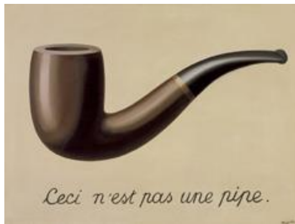
Imagem 1 - A traição da imagem.

Tomemos como exemplo a famosa obra de René Magritte (COCHRAN, 2006), na qual um artefato (imagem 1) é exibido com a legenda “ Ceci n'est pas une pipe ”. A leitura de que “isto não é um cachimbo” nos força a perceber aquilo como o que é e não como o que representa.