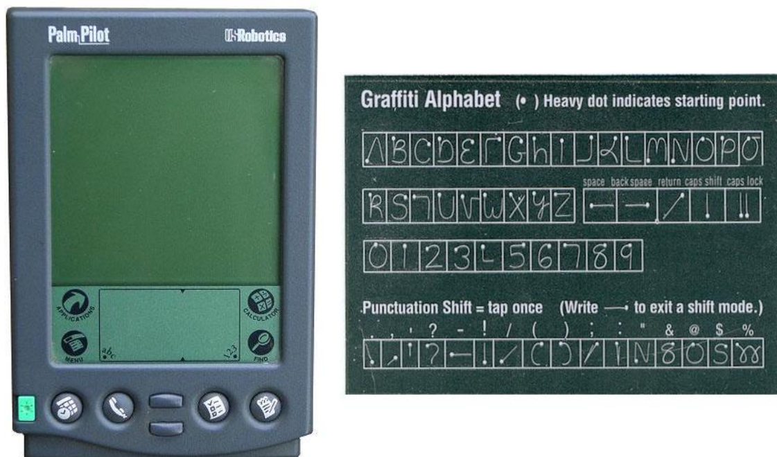
Imagem 2 - PalmPilot e a linguagem Graffiti.

Podemos observar um exemplo disso no estudo de caso apresentado por Wigdor e Wixon (2011). O Palm Pilot (imagem 2) funciona como uma espécie de assistente pessoal digital lançado no mercado em 1997 pela empresa USRobotics.