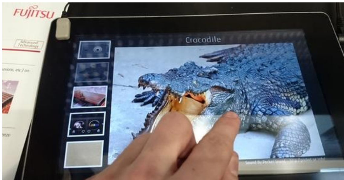
Imagem 4 - Protótipo háptico exibindo um crocodilo.

Durante a fase de codificação deste objeto, os programadores da Fujitsu tiveram que recorrer aos referenciais de conhecimento tátil e planejar as relações possíveis com o objeto em tela frente às possibilidades técnicas da infraestrutura disponível para, finalmente, criar um objeto visual-tátil significativo. O usuário do tablete, por sua vez, provavelmente não tenha tido a oportunidade de passar sua mão em um crocodilo vivo, seja pelo risco que esta atividade representaria, seja pela crescente carência de crocodilos disponíveis nas cidades.