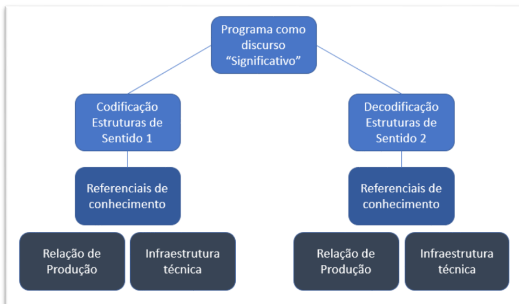
Imagem 3 - Diagrama Codificação e Decodificação.

O processo de geração desta linguagem se aproxima com a abordagem de Hall (2006, p. 389). Para ele, “é claro que processo de produção não é isento de seu aspecto “discursivo”: ele também se constitui dentro de um referencial de sentidos e ideias”. Ou seja, aquilo que o usuário conhece atua na formulação daquilo que ele compreende (imagem 3).