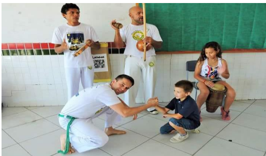
Figura 2 - Capoeira

2. Capoeira: Muitas apresentações foram realizadas com convidados da comunidade. Capoeira, música, arte, cultura, coreografia e desfile de figurinos afro-brasileiros fizeram parte da agenda da Semana da Consciência Negra JCN.