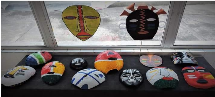
Figura 1 – Mostra Máscaras Africanas

2. Capoeira: Muitas apresentações foram realizadas com convidados da comunidade. Capoeira, música, arte, cultura, coreografia e desfile de figurinos afro-brasileiros fizeram parte da agenda da Semana da Consciência Negra JCN.