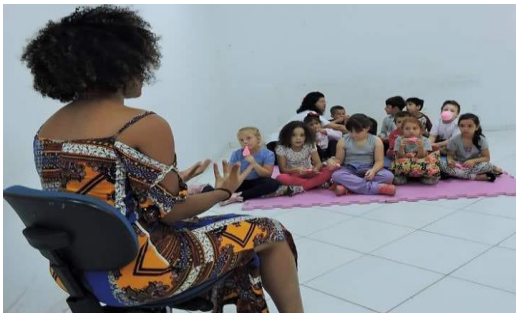
Figura 4. Contação de lendas e contos africanos

4. Contação de lendas e contos africanos: as histórias representam indicadores efetivos para situações desafiadoras, além de fortalecerem vínculos sociais, educativos e afetivos. Então o ato de contar histórias é uma ferramenta que pode despertar pequenos leitores e estimular para o mundo da imaginação. A contação de lendas e contos africanos foram os articuladores do projeto junto às brincadeiras com jogos étnico-africanos – procurando integrar os Anos Iniciais e os anos Finais do Ensino Fundamental com o Ensino Médio.