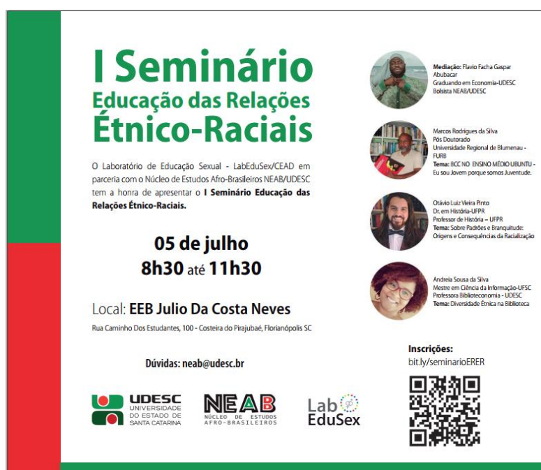
Figura X. Folder do I Seminário ERER

Na continuidade do trabalho, no ano de 2019, as ações do OBERER expandem-se com a parceria do Laboratório de Educação e Sexualidade (LabEduSex) do Centro de Educação a Distância/CEAD/UDESC e juntos promovem o I e II Seminário Educação das Relações Étnico-Raciais no espaço da Escola de Educação Básica Júlio Costa da Neves, da rede estadual de ensino catarinense. Os referidos Seminários objetivaram fomentar o debate sobre a temática da ERER como política curricular e subsidiar ações de extensão alinhadas com os percursos formativos dos profissionais da escola, professores da Educação Básica e Superior, pesquisadores, estudantes de graduação e pós-graduação, movimentos sociais e comunidade em geral.