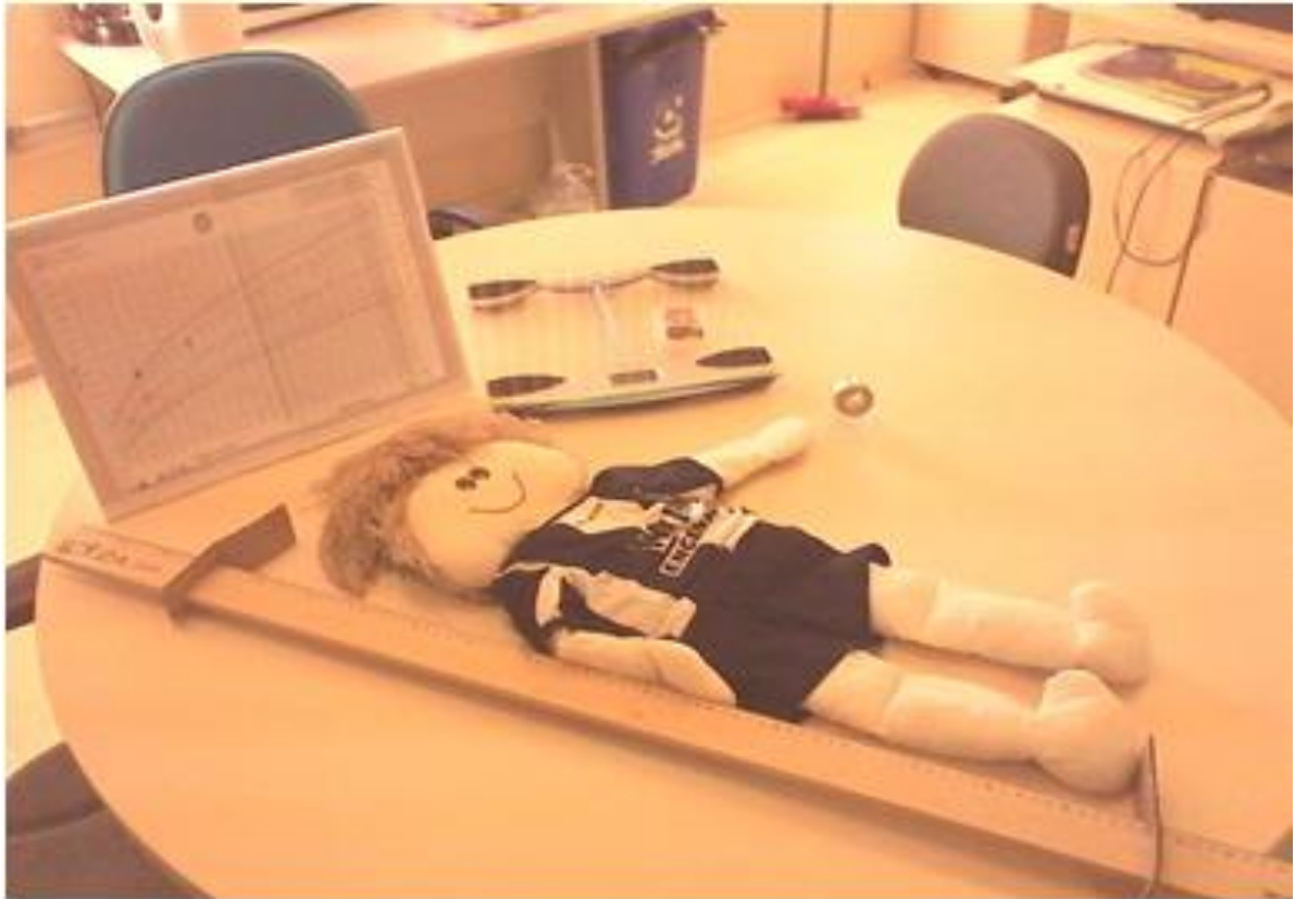
Figura 1: Instrumentos para a mensuração do crescimento infantil