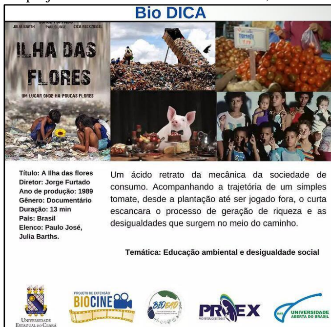
Figura 02. Card do quadro “BioDica” sobre o filme “A ilha das flores” postado no Instagram do projeto BioCine: Cinema com Ciência, ano 2021.

Os filmes sugeridos eram também explorados nos cards do quadro “BioDica” o que proporcionou um retorno positivo para o alcance do IG do projeto, além de obter também um bom rendimento em relação aos comentários nas publicações e interações com os seguidores (Figura 2).