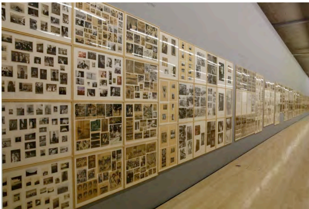
Figura 2- Gerhard Richter, Atlas , 2010.

diante. Contudo, algumas coleções se estruturam a partir de recortes subjetivos e particulares definidos pelo colecionador. Esse tipo de coleção se constrói como invenção de um mundo pautado pelo desejo ou “necessidade de fixar as ordens que nos permitam sobreviver ao caos da multiplicidade e da diversidade”. (Maciel, 2009, p.16) É por essa perspectiva da coleção, enquanto processo de pesquisa e estruturação da obra, que se configuram trabalhos como Atlas , de Gerhard Richter (Figura 2) e na série de livros O Bairro , de Gonçalo M. Tavares (Figura 3).