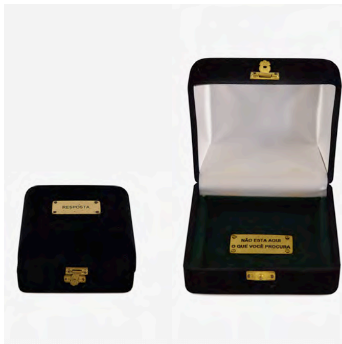
Figura 1 - Cildo Meireles, Resposta , 1974

Pensando a pesquisa enquanto busca, Maurice Blanchot, em A Conversa Infinita , reflete sobre esse caminho percorrido: “Encontrar é tornejar, dar a volta, rodear. [...] Aqui não existe nenhuma ideia de finalidade [...] Encontrar é quase a mesma palavra que buscar, que diz: ‘dar a volta em’.”(2001, p.63-64). A pesquisa, enquanto ato, é sinônimo de busca e tem como desejo de resultado o encontro – o que seria diferente de seguir objetivos e buscar soluções para problemas. Para tanto, algumas questões podem ser postas em relação ao encontro: O que é? Como acontece? O que o possibilita? O que é possível? Seria achar ou perder? Seria uma relação ou uma justaposição? Acontece pela aproximação ou pela diferença?