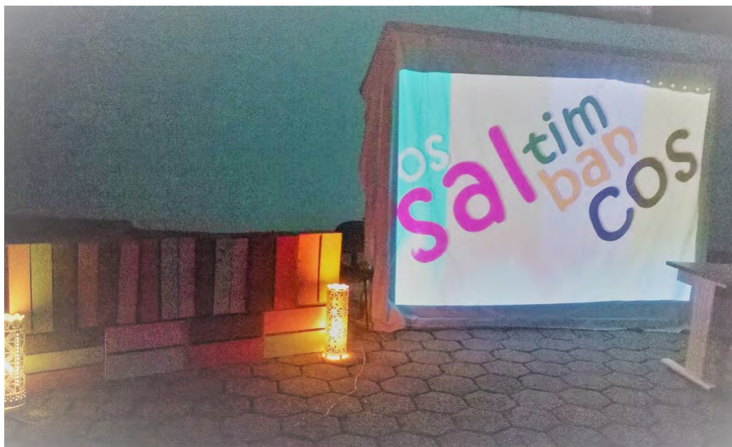
Figura 4 – Abaixo é possível ver parte do cenário usado, ainda em construção. O telão ligado estava sendo testado. Nele foi projetada a sombra do personagem Barão.