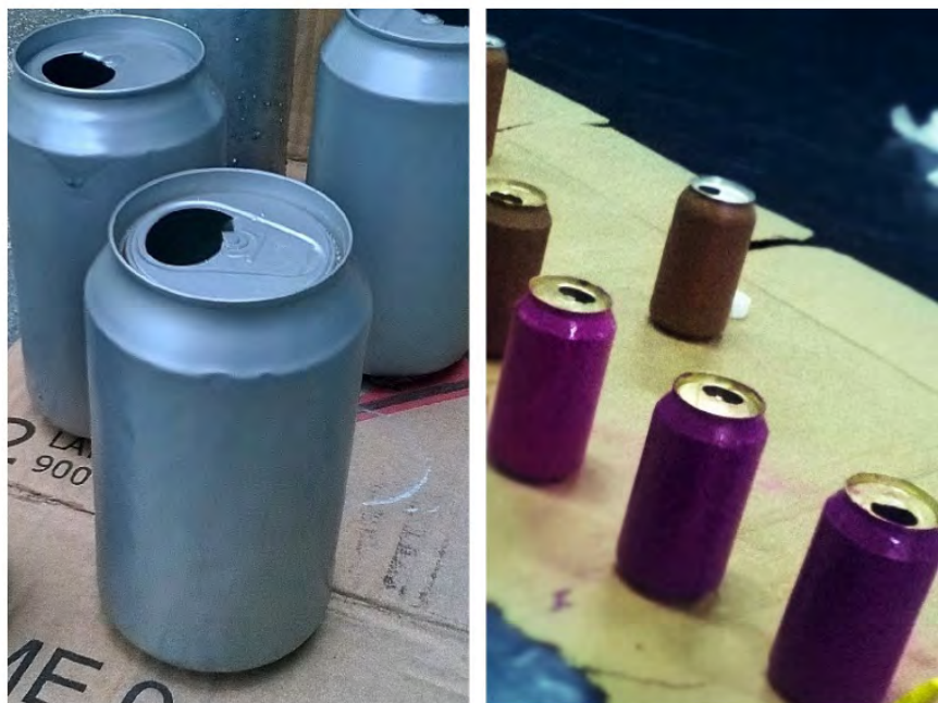
Figura 5 – Na imagem abaixo é possível ver as latinhas utilizadas no espetáculo. A confecção se deu entre os jovens-artistas e mestre-encenadores.

A escolha de utilizar instrumentos alternativos se deu principalmente para provocar a reflexão crítica do espectador. Pois o material reciclável sendo utilizado em cena, colabora significativamente para um distanciamento, devido ao contexto político-cênico.