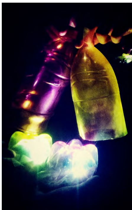
Figura 2 – Garrafas utilizadas no espetáculo como recurso de iluminação e cenografia, simultaneamente.

Para exemplificar a proposta, apresento em seguida duas fotografias das garrafas pets que foram pintadas para compor a cenografia. Ressalto ainda que ao pintar as garrafas na tentativa de projetar cores à iluminação cênica, o objeto iluminador se integra à cenografia do espetáculo.