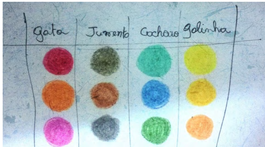
Figura 1 –Abaixo temos a paleta de cores que norteou as pesquisas dos elementos visuais (figurino, maquiagem, cenografia).