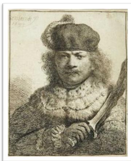
Figura 03 - Autorretrato como oriental , 1634

É sabido, por exemplo, através de seu inventário, que o artista era possuidor de trajes orientais, além de guardar também vestuários relativos ao Renascimento na Itália. A partir dessas fontes in loco e, claro, também a da movimentação de retratos famosos pintados por Rafael e Tiziano, Rembrandt conseguia transformar-se em outros, através da inclusão de sua efigie. (figura 03).