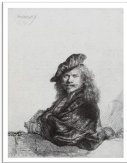
Figura 05 – Autorretrato apoiado em um corrimão

exercia tal domínio que poderia alterar, deformar e abstrair como quisesse. (Vançan, 2003, p. 22)