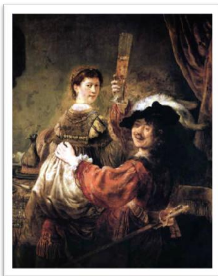
Figura 02 - Autorretrato com Saskia (1635)