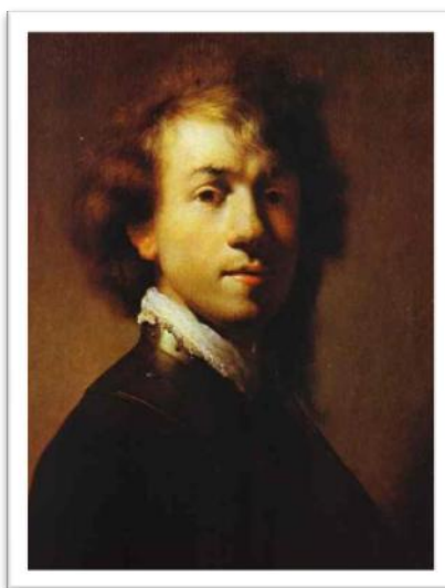
Figura 08 – Autorretrato com 23 anos, 1629, óleo sobre madeira