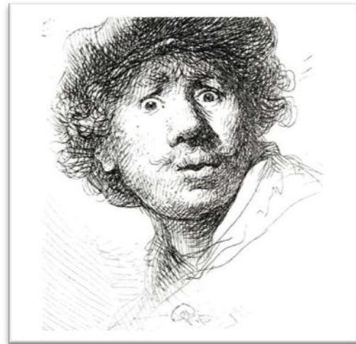
Figura 07 – Autorretrato Rembrandt

Observando a obra Autorretrato com 23 anos de 1629 (figura 08) vemos uma figura jovem e ingenuamente vaidosa. A gola da roupa, de característica militar, dá certa formalidade à aparência pessoal. A fisionomia jovial de frente para o espectador e com a metade do rosto iluminado valoriza a postura do conjunto. O cabelo de Rembrandt apresenta-se suave nos seus tons castanhos, ganhando especial beleza através dos fios alourados pela luz, formando uma expressiva mecha que pende sobre sua testa. A vivacidade da juventude, com seus desejos e ambições, está contida no olhar confiante do artista. A pintura apresenta um realismo muito admirado pelos holandeses da época. Este autorretrato do início de sua carreira atesta a importância da iluminação em sua linguagem. O contraste entre sombra e luz divide seu rosto em duas partes, formando uma linha invisível que realça a verticalidade da figura. A sombra da cabeça no plano de fundo ressalta a face iluminada e acentua a expressividade do conjunto facial. Os tons terrosos que predominam no quadro, junto com a luz da composição, resultam em um pequeno plano retangular iluminado, para onde a atenção do nosso olhar é concentrada. O olhar percorre a gola branca, passando pelos lábios ligeiramente avermelhados e vai até a mecha loura de cabelos 16 .