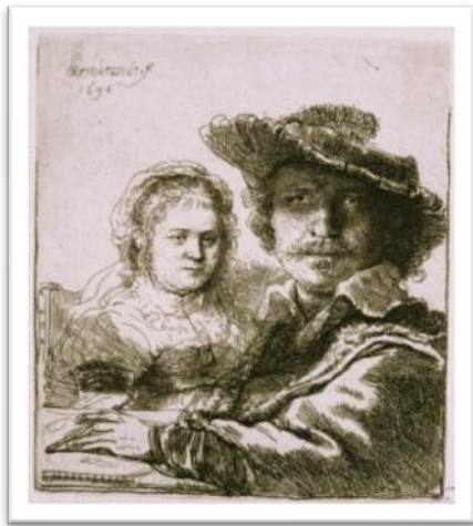
Figura 06 – Autorretrato com Saskia , gravura, 1636