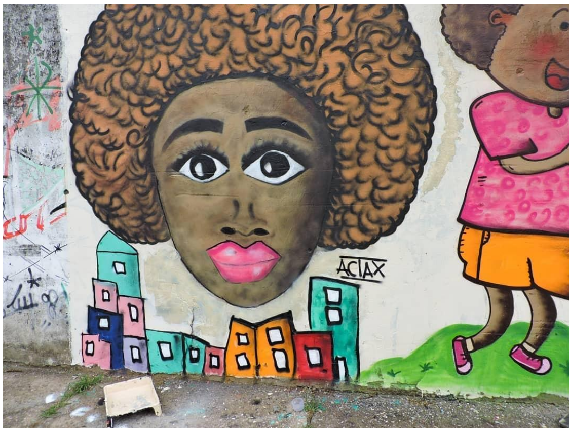
IMAGEM V – Representação da mulher negra na favela do Nelson Mandela, no complexo de Manguinhos.