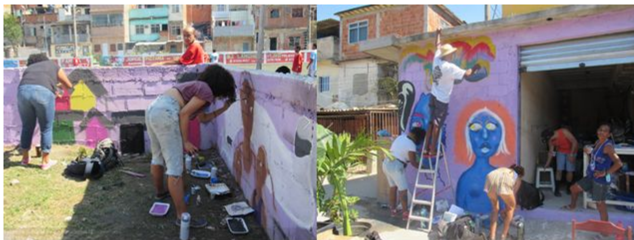
IMAGEM IV – Jovens e adultos expressando suas aspirações em murais.