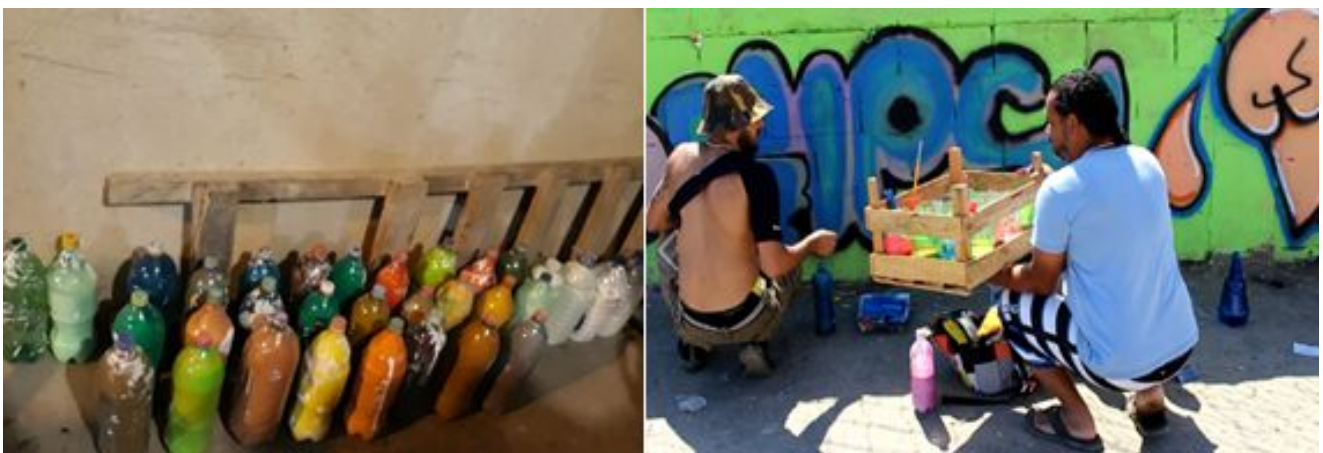
IMAGEM II – Materiais do projeto “Brabas Crew” para o desenvolvimento da arte do graffiti.

De modo geral, o projeto sobrevive de doações, sobretudo de parceiros locais que são pessoas físicas e empresas que contribuem para a manutenção das oficinas através dos donativos de matérias para o graffiti, que são: latas de tintas látex, spray, bandejas para tinta, espátulas, lixas, pinceis e rolos para pintura.