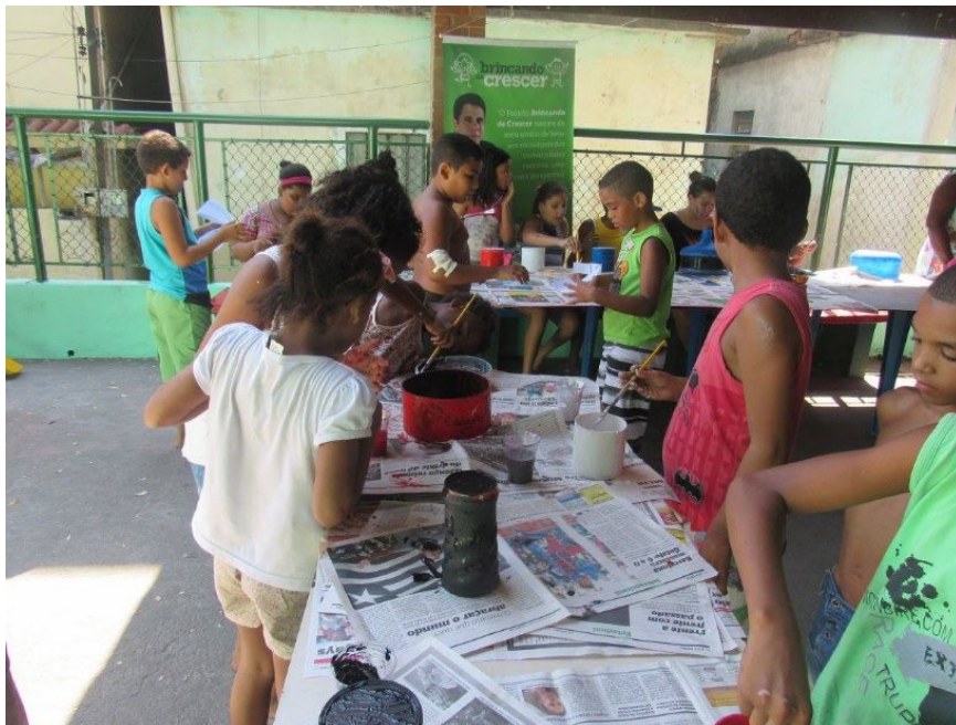
IMAGEM III – Oficina de leitura e prática da arte do graffiti com crianças da favela.