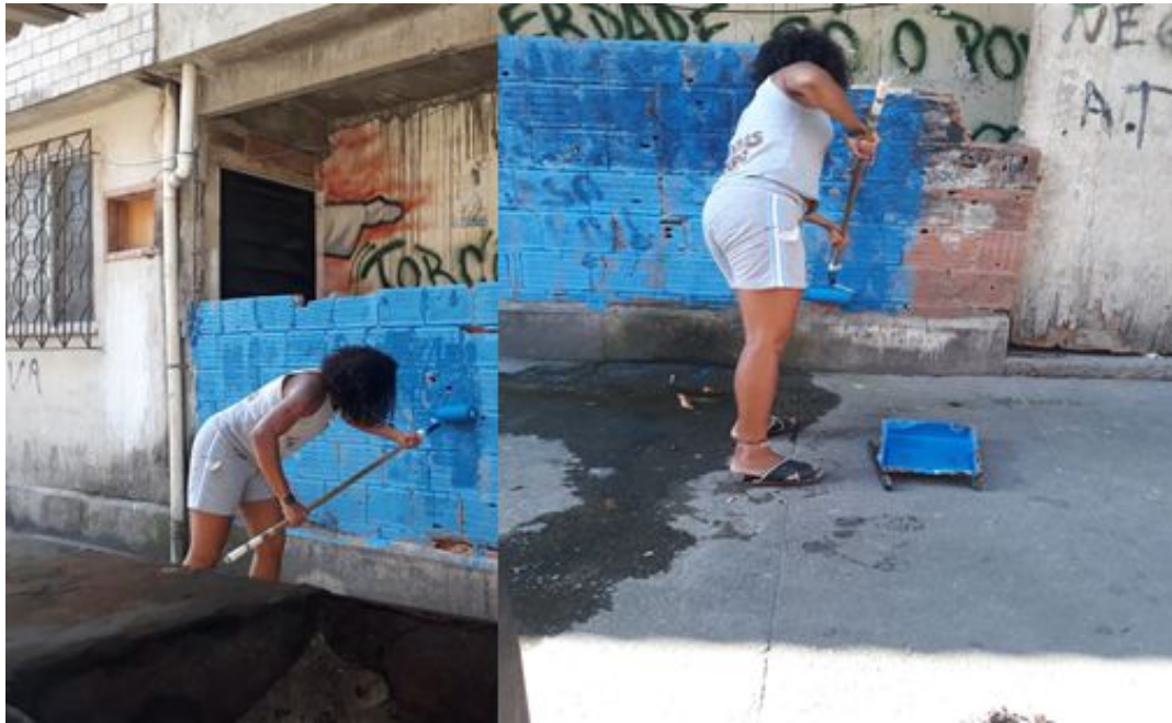
IMAGEM VI – Muro com marcas de tiros sendo preparado para receber a arte através do graffiti.