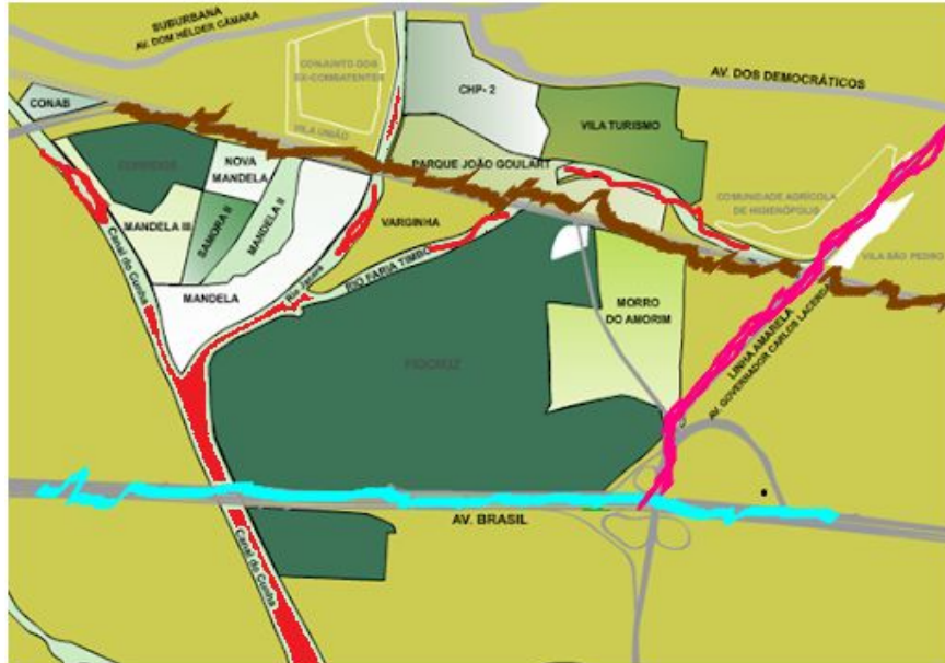
IMAGEM I – Mapa do complexo de Mangueiros.